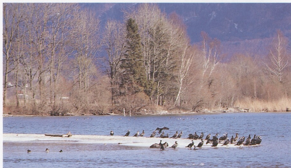
Životní prostředí: Potoky, řeky a jezera 48 – 75