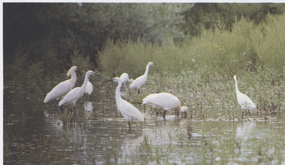
Životní prostředí: Louky, bažiny a rašeliniště 120 – 139