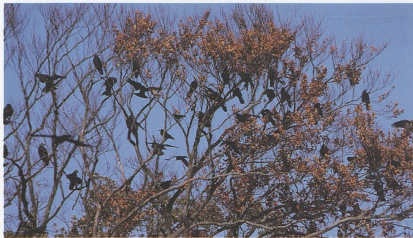
Životní prostředí: Stromy a keře 8 – 47