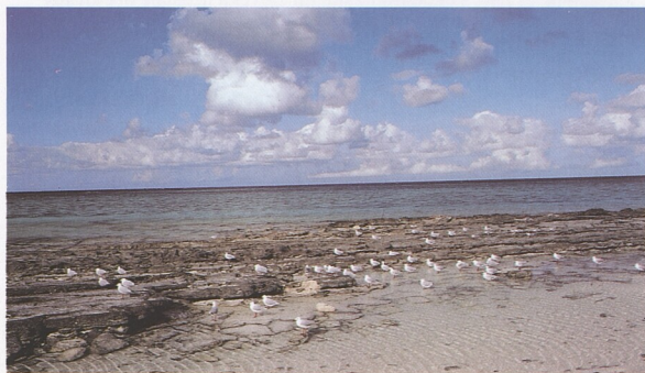
Životní prostředí: Moře a pobřeží 76 – 101