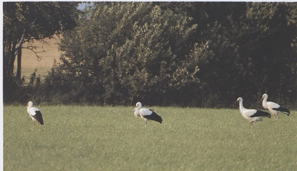
Životní prostředí: Pole a lada 102 – 119