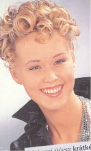
Večerní účesy krátké