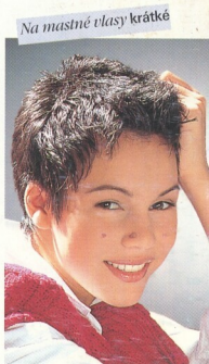
Na mastné vlasy krátké