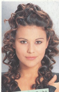
Večerní účesy dlouhé