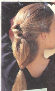
Večerní účesy dlouhé