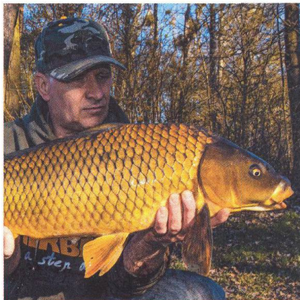
30 Mělčiny s krmítkem, nebo bez?