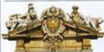
Heraldický štít nad vchodem do norimberské radnice