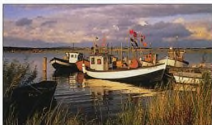
Malebná jezerní krajina v Meklenbursku