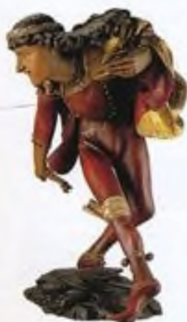
Socha tanečníka v Městském muzeu v Mnichově (viz str. 214)