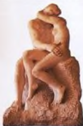
Auguste Rodin: Políbek (1886)