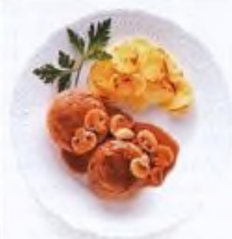
Noisettes – jehněčí kotlety