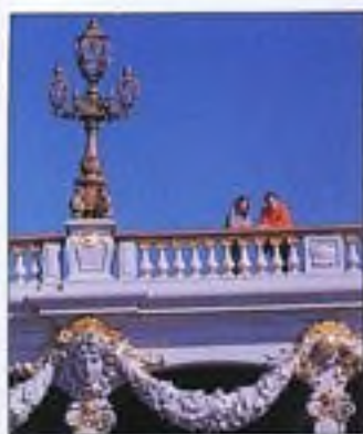
Most Alexandra III.