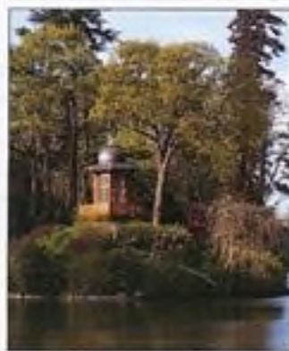
Ostrov v Buloňském lesíku