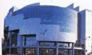
Opéra National de Paris Bastille