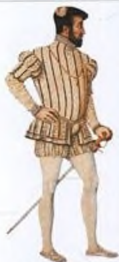
Jindřich II. (1547–59)