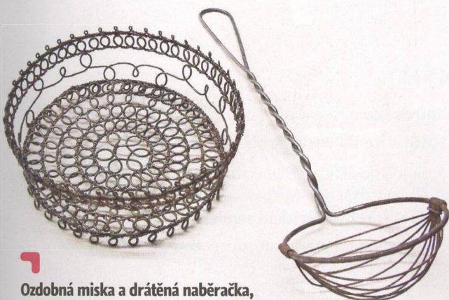
Ozdobná miska a drátěná naběračka, produkt dnešního uměleckého drátenictví (s. 90)

Ve sbírkách Národního zemědělského muzea se nachází masivní dubový lis z roku 1705