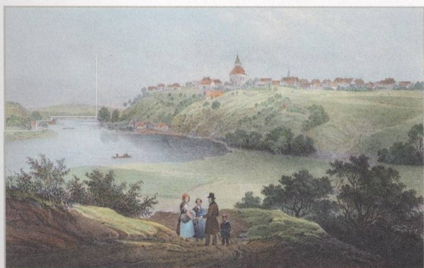
Týnecké pahorky na grafice C. W. Airdta z roku 1845 (s. 46)