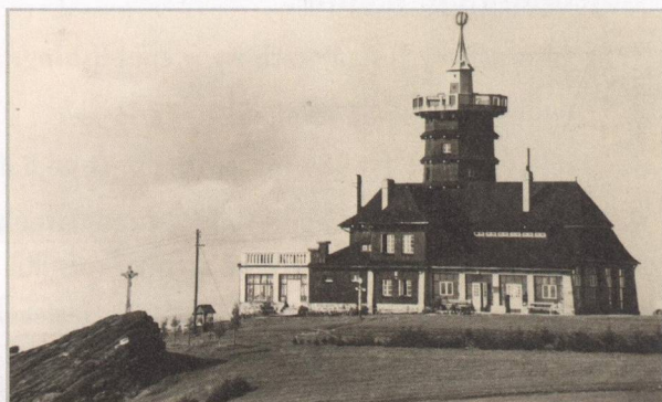
Jiráskova chata na Dobrošově, projektovaná Dušanem Jurkovičem, byla slavnostně otevřena v roce 1923 (s. 68)

František Ladislav Rieger patřil k charismatickým postavám české politiky a kultury 19. století