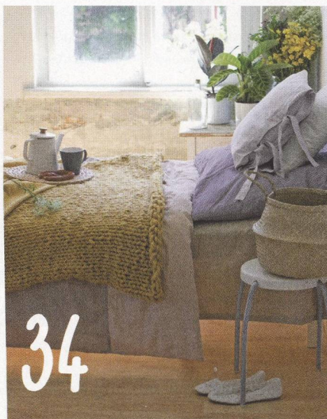
XXL TREND V PLETENÍ