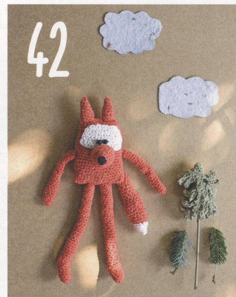
DĚTEM DO POSTÝLEK