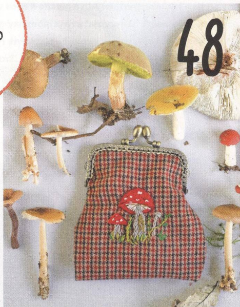
JDEME NA HOUBY