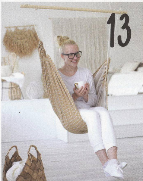
HOUPÁNÍ NA POHODU