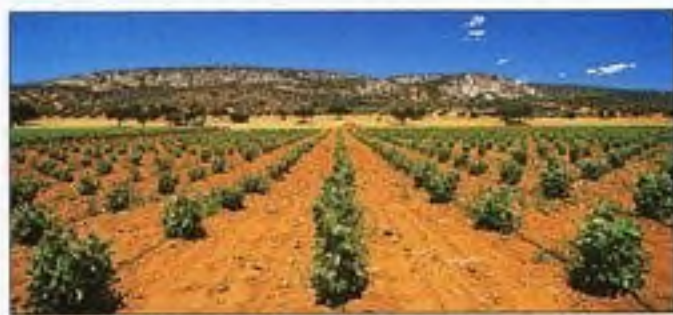
Pěstování hroznového vína v La Manche, kde se nacházejí nejrozsáhlejší vlnice na světě