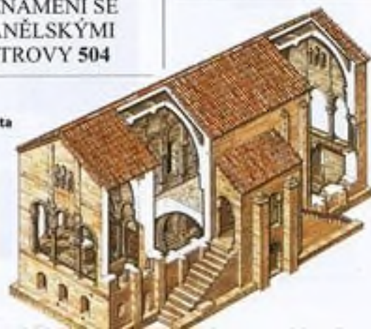
Chrám Santa María del Naranco v Asturii