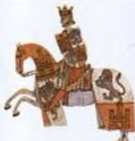
Král Alfons X. Učený