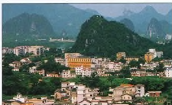
Působivé krasové útvary ve městě Guilin v Guangxi