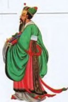
Konfucius (551–479 př. Kr.)