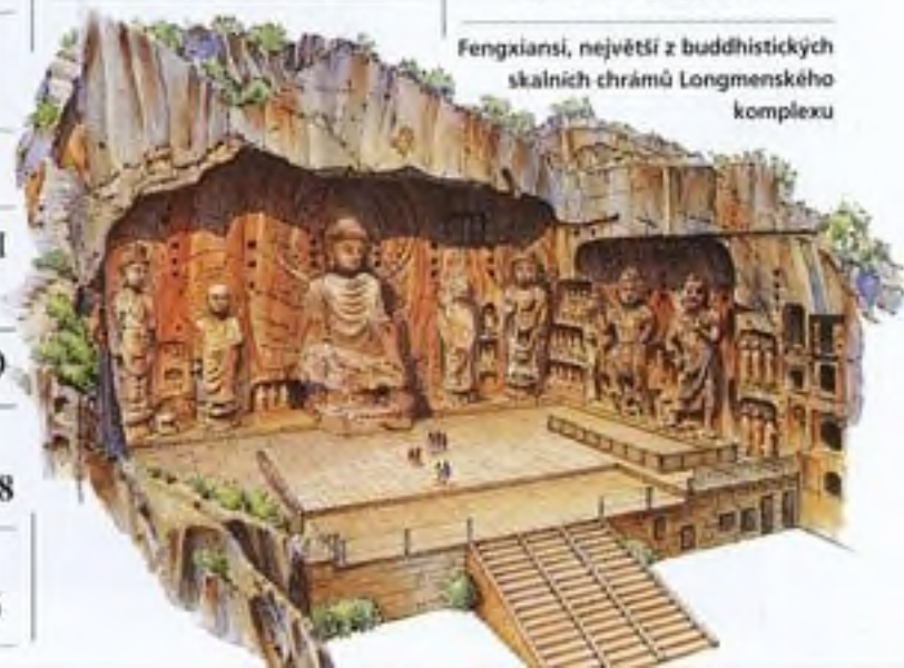
Fengxiansi, největší z buddhistických skalních chrámů Longmenského komplexu