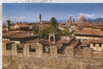
Pohled ze San Niccolò na centrum města