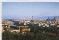
Pohled na centrum města