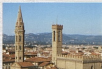
Pohled na Cappella dei Pazzi a Badia Fiorentina