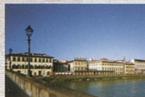
Paláce na břehu Arna