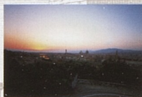
Pohled na Oltrarno z kampany