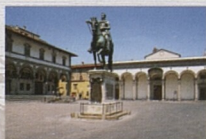
Piazza Santissima Annunziata