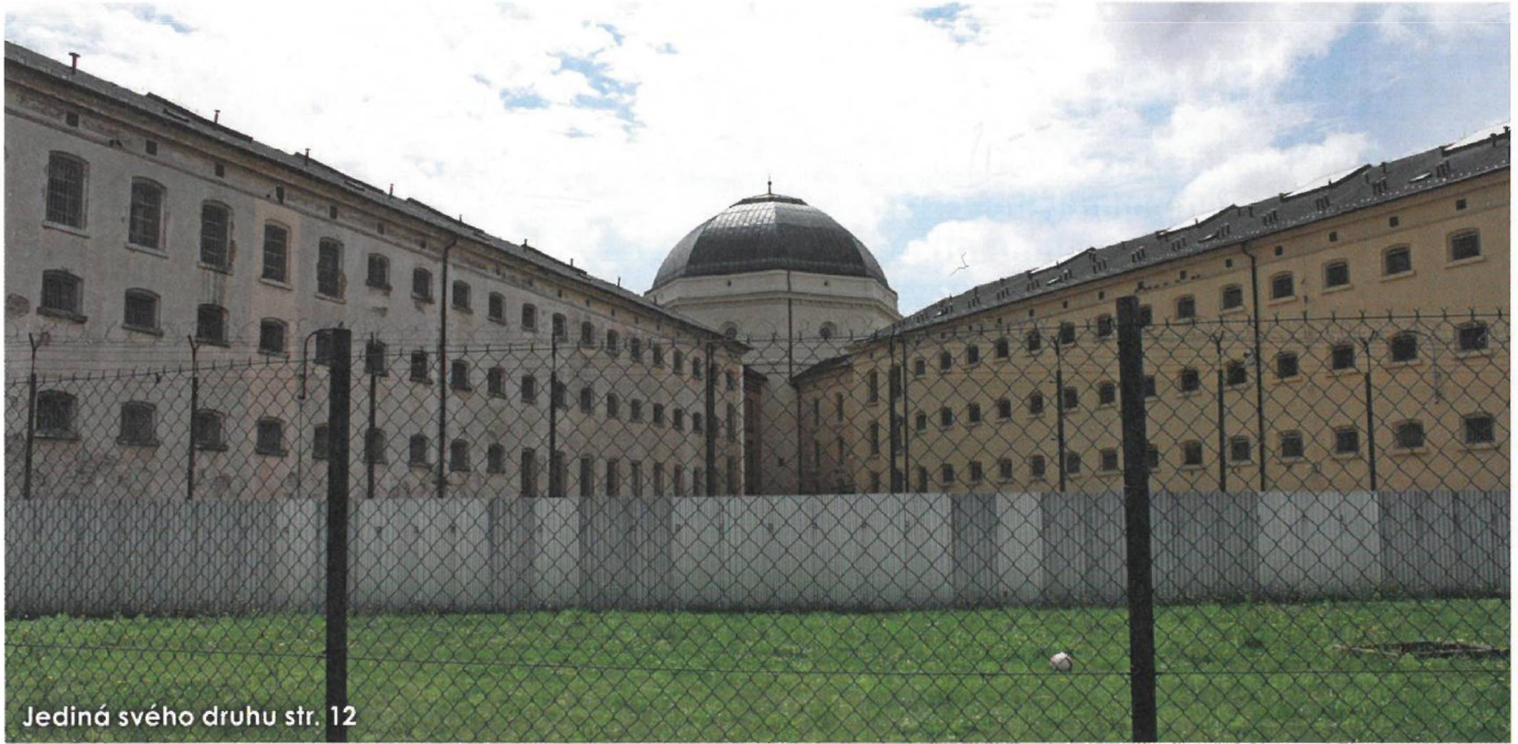
Jediná svého druhu str. 12