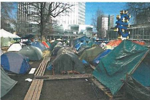
Reportáž z okupované banky. Evropská centrální banka tahá eurozónu z potíží, kritizují ji levicoví demonstranti i konzervativní Němci.