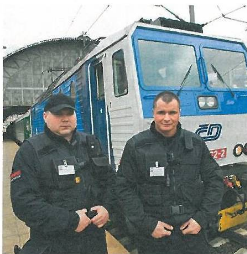
Soukromá policie zasahuje. Černí šerifové vyrážejí do ulic českých měst nahrazovat policisty.