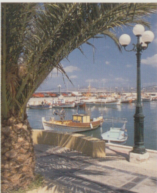
Přístav v Sítii