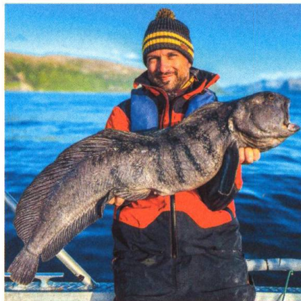
28 Vlkouši a okouníci