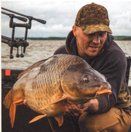
04 Lov na Nových Mlýnech