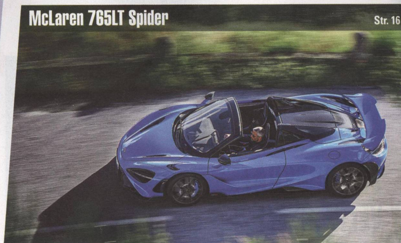
McLaren 765LT Spider