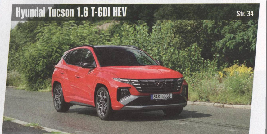
Hyundai Tucson 1.6 T-GDI HEV