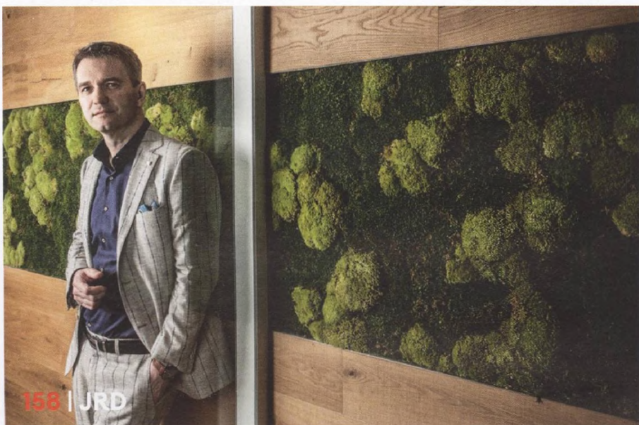
158 | JRD