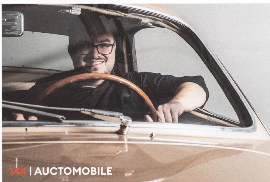
144 | AUCTOMOBILE