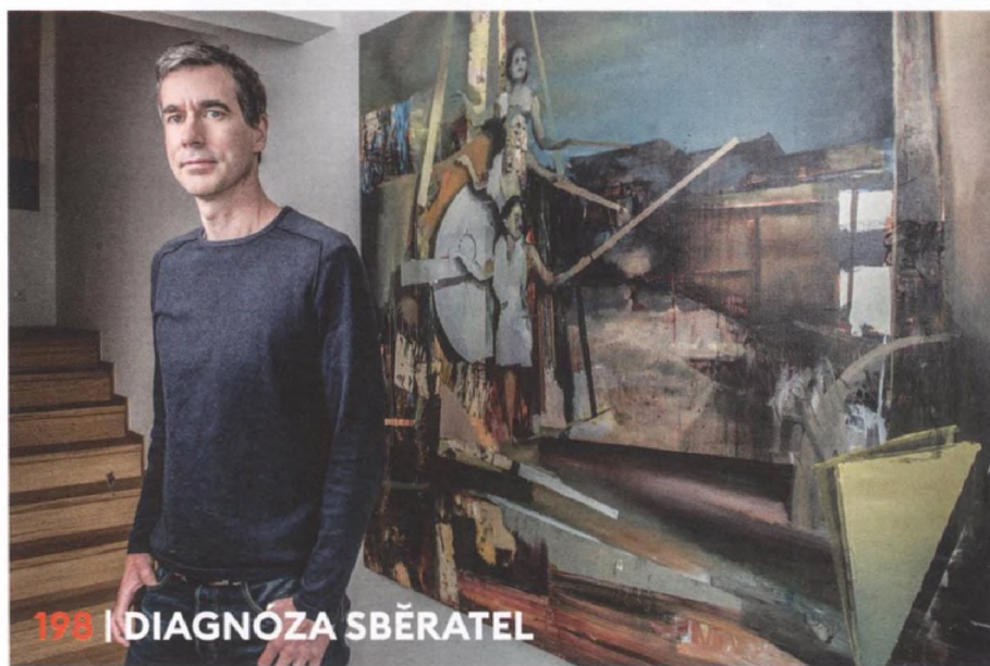
198 | DIAGNÓZA SBĚRATEL