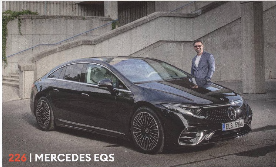
226 | MERCEDES EQS