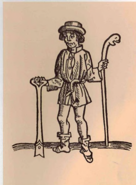
Pozdně středověký zemědělec s holí a úzkým rýčem (Stephanus Boek van dem Shakspele, Lübeck, 1498, dřevorez).

RÝČ A PŘESLIČE • SOCIÁLNÍ STATUS ROLNÍKA • STRUKTURA OSÍDLENÍ: DVORY A VESNICE • RADONICE NAD OHŘÍ A DALŠÍ ČESKÉ ZEMĚPANSKÉ DVORY • STŘEDOVĚKÉ VESNICE A PUTUJÍCÍ ZEMĚDĚLCI • URBÁŘE • TVAR POLÍ • CHLĚB NA HNOJI VYROSTLÝ • DALŠÍ TŘI PŘÍBĚHY: TENTOKRÁT O LESNÍCH PŮDÁCH • LUPINA A LES • MNIŠKA, BÍLÝ LESMISTR A ZALESŇOVÁNÍ KALAMITNÍCH HOLIN • Z VÁLČEJNÝCH ZÁPISKŮ MÉHO DĚDEČKA