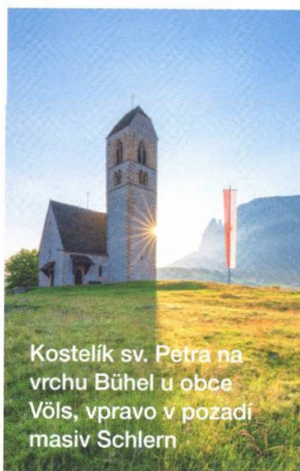
Kostelík sv. Petra na vrchu Bühel u obce Völs, vpravo v pozadí masiv Schlern