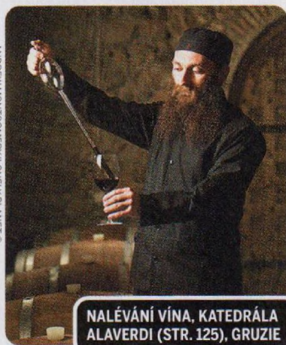
NALÉVÁNÍ VÍNA, KATEDRÁLA ALAVERTI (STR. 125), GRUZIE