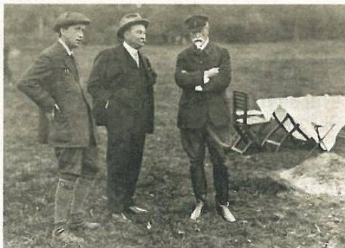
„Kmotři“ první republiky.