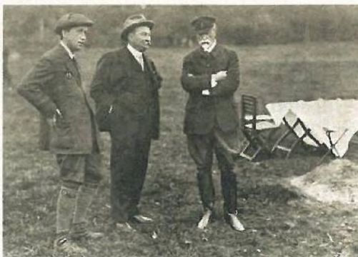
„Kmotři“ první republiky.

Preiss, Loevenstein či Baťa byli podnikatelé, kteří představovali stínovou vládu předválečného Československa a hýbali jeho ekonomikou.