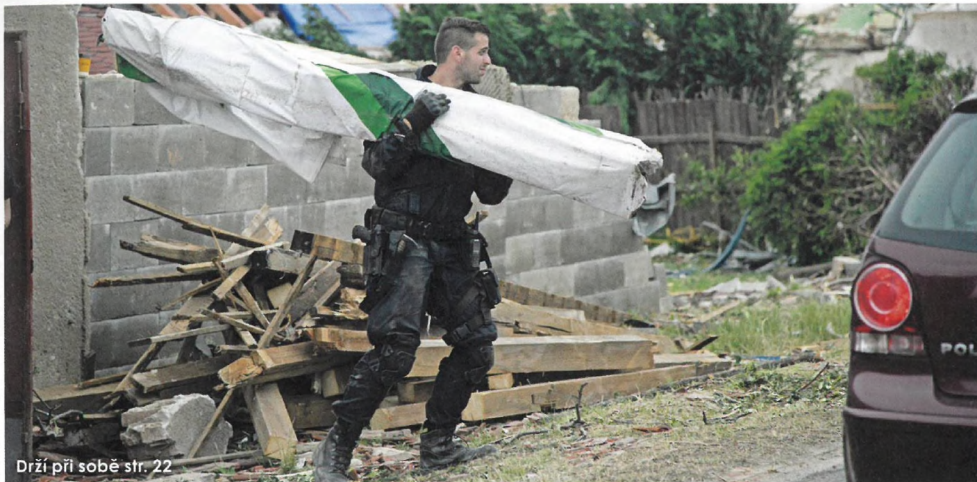
Drží při sobě str. 22