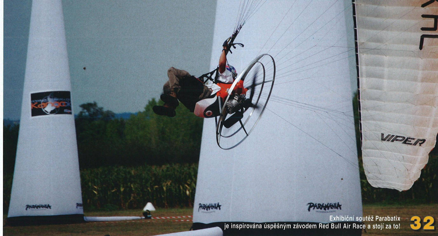
Exhibiční soutěž Parabatix je inspirována úspěšným závodem Red Bull Air Race a stojí za to!