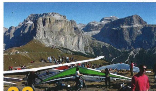
Optické iluzi může podlehnout i sebezkušenější pilot. David Melechovský nás s iluzemi seznámí