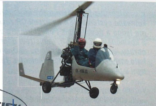
Znovu se zakládá Svaz vírníkového létání

POVINNÝ VÝTISK Krajská knihovna Karlovy Vary 10