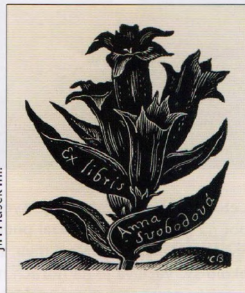
Jirí Hušek ml.

Drobná grafika původně identifikující majitele knihy je dnes samostatnou výtvarnou disciplínou