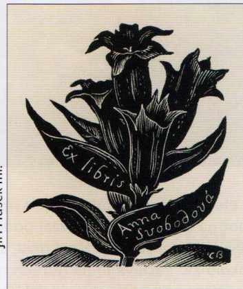
Jiří Hušek ml.

Drobná grafika původně identifikující majitele knihy je dnes samostatnou výtvarnou disciplinou