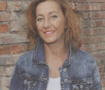
VANDA HYBNEROVÁ herečka