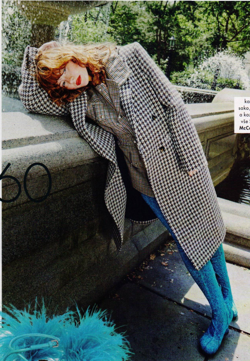
kabát, sako, košile a kozačky, vše Stella McCartney