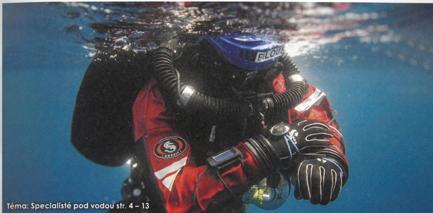
Téma: Specialisté pod vodou str. 4 – 13