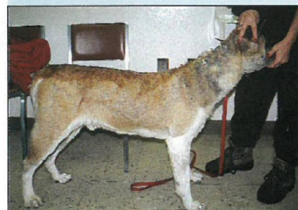
... str. 72