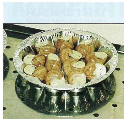
... str. 55

Obrázek na titulní straně: Šneci po burgundsku.