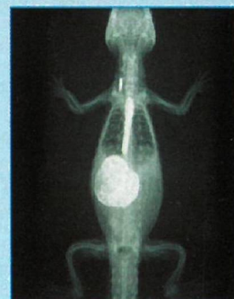
... str. 384