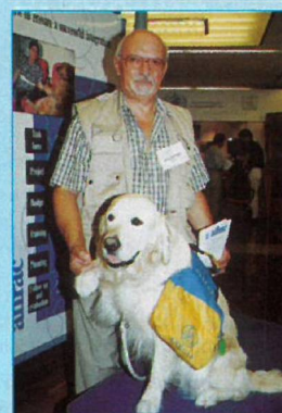
... str. 506