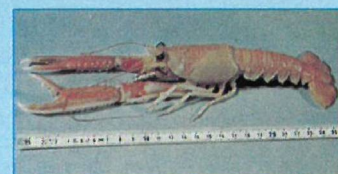
... str. 546