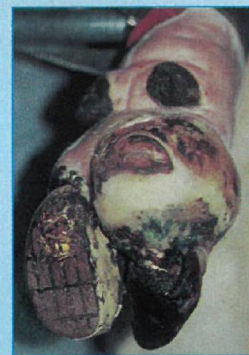
... str. 538

Autorem fotografie korunáče (Nová Guinea) na titulní straně je Otakar Tučka.