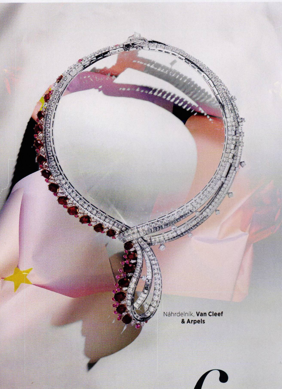
Náhrdelník, Van Cleef & Arpels

Pokochejte se nejkrásnějšími kusy ze šperkařských ateliérů světových značek.