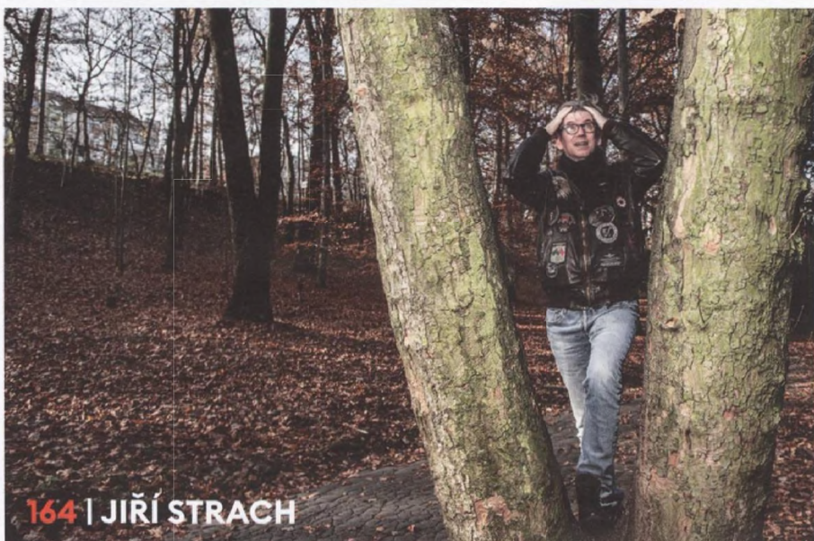
164 | JIŘÍ STRACH