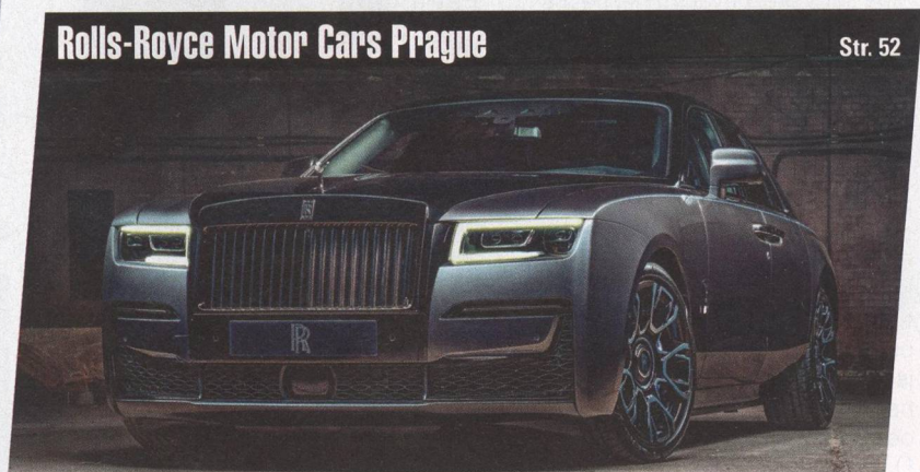
Rolls-Royce Motor Cars Prague