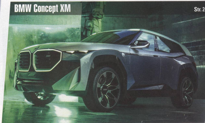
BMW Concept XM