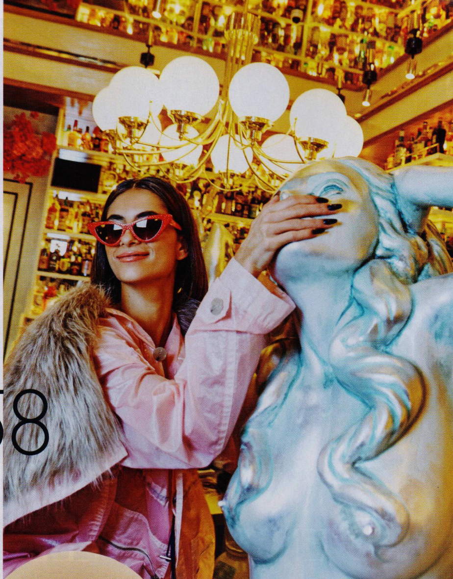
růžový trench s liščí kožešinou, Nina Ricci ; cool brýle, Guess Eyewear