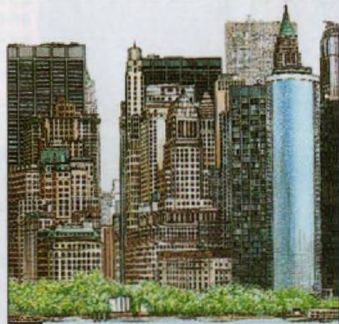
Silueta jižního Manhattanu