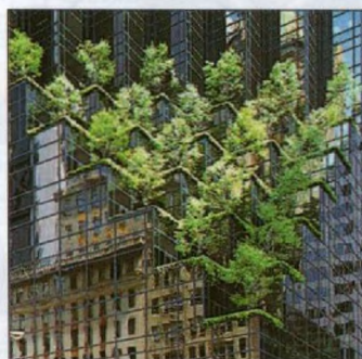
Trump Tower, Upper Midtown