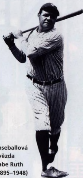
Baseballová hvězda Babe Ruth (1895–1948)