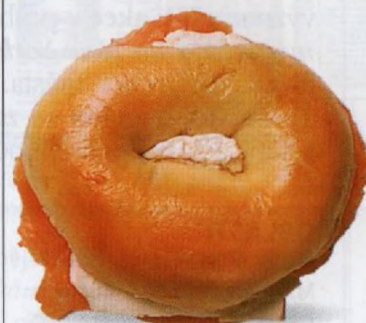
Bagel z newyorského lahůdkářství