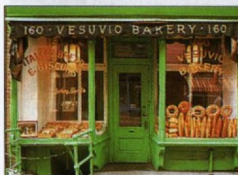
Pekařství Vesuvio, SoHo