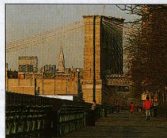
Nábřežní promenáda v Brooklynu