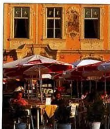
Kavárenské stolky v zahrádce