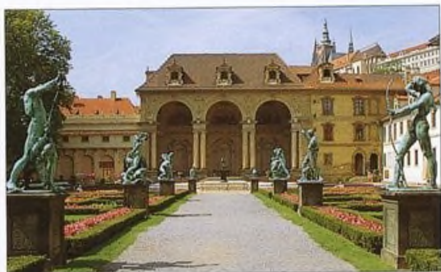
Valdštejnský palác a jeho zahrada na Malé Straně