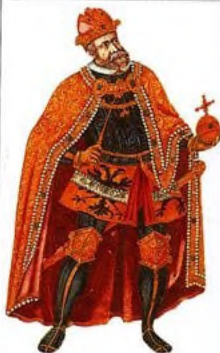
Rudolf II. (1576–1611)