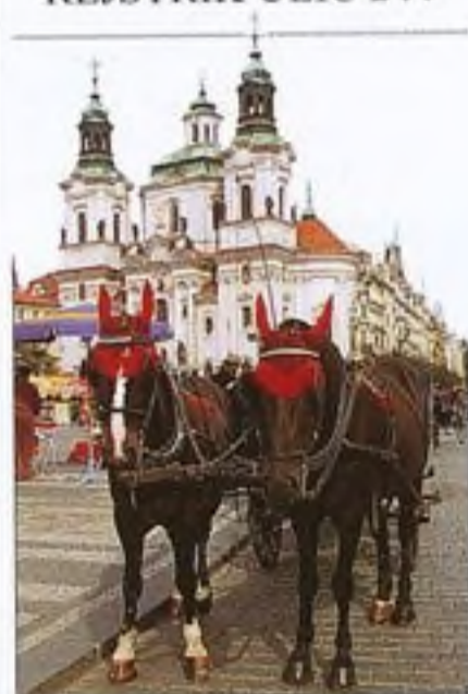
Drožka, Staroměstské náměstí