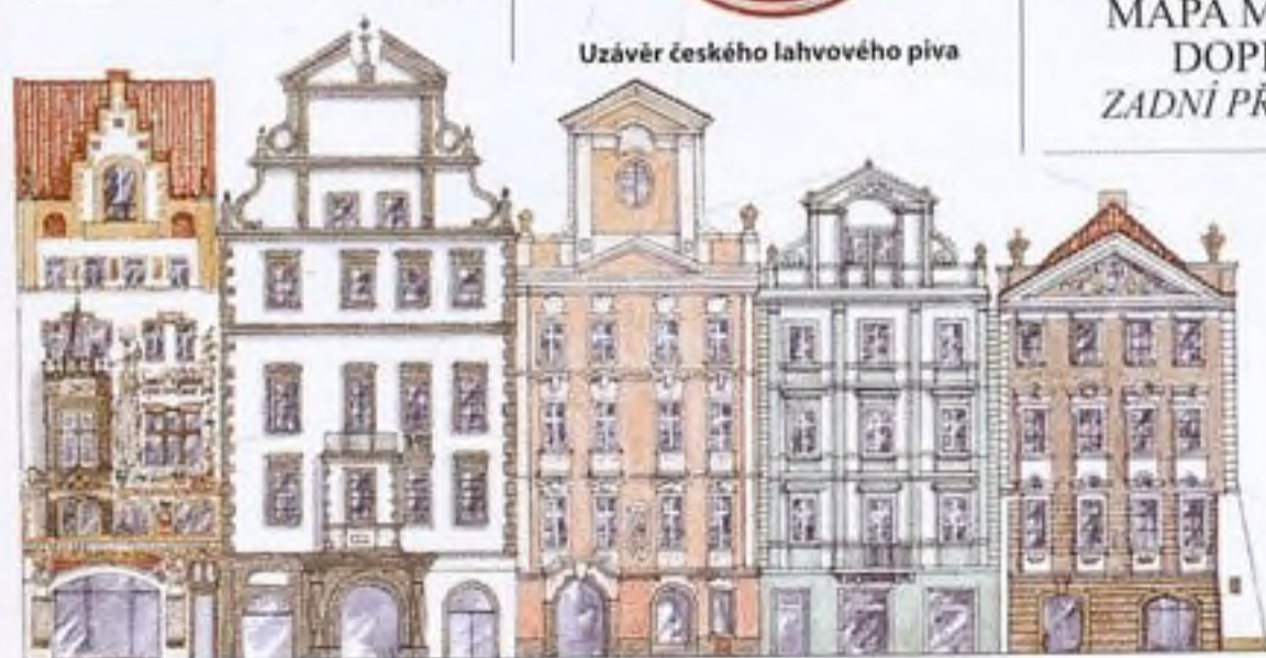
Barokní průčelí domů v jižní části Staroměstského náměstí