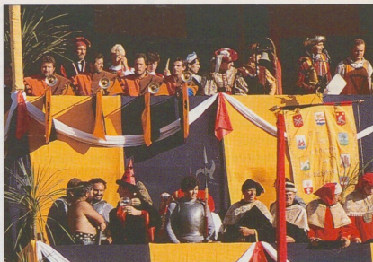
Středověký Palio dei Dieci Comuni v Montagnaně