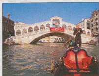
Ponte di Rialto klenoucí se přes Velký kanál