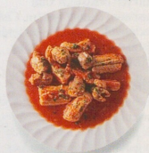
Anguilla in umido