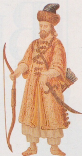
Benátský mořeplavec Marco Polo