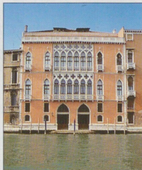
Palazzo Pisani Moretta na břehu Velkého kanálu