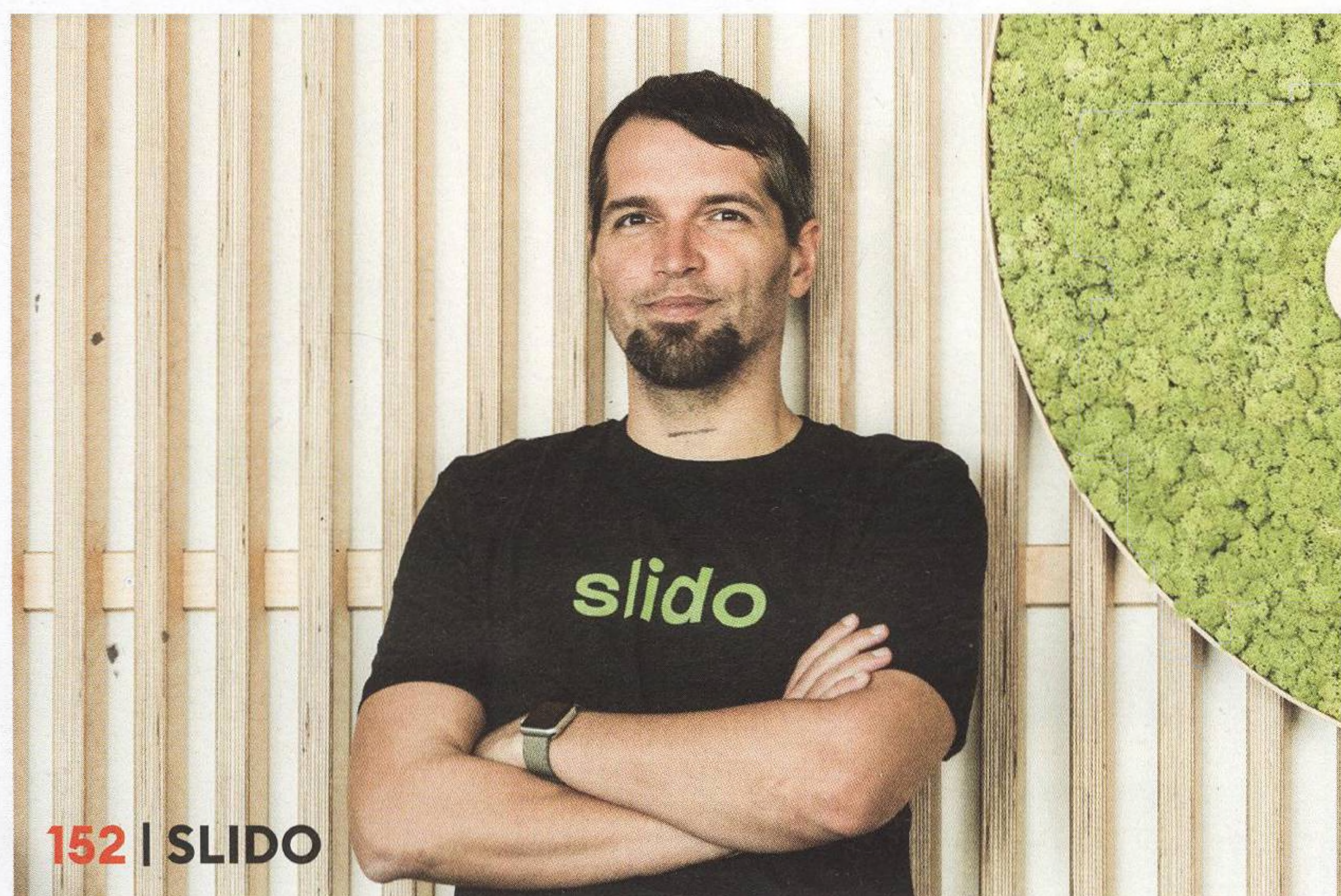
152 | SLIDO