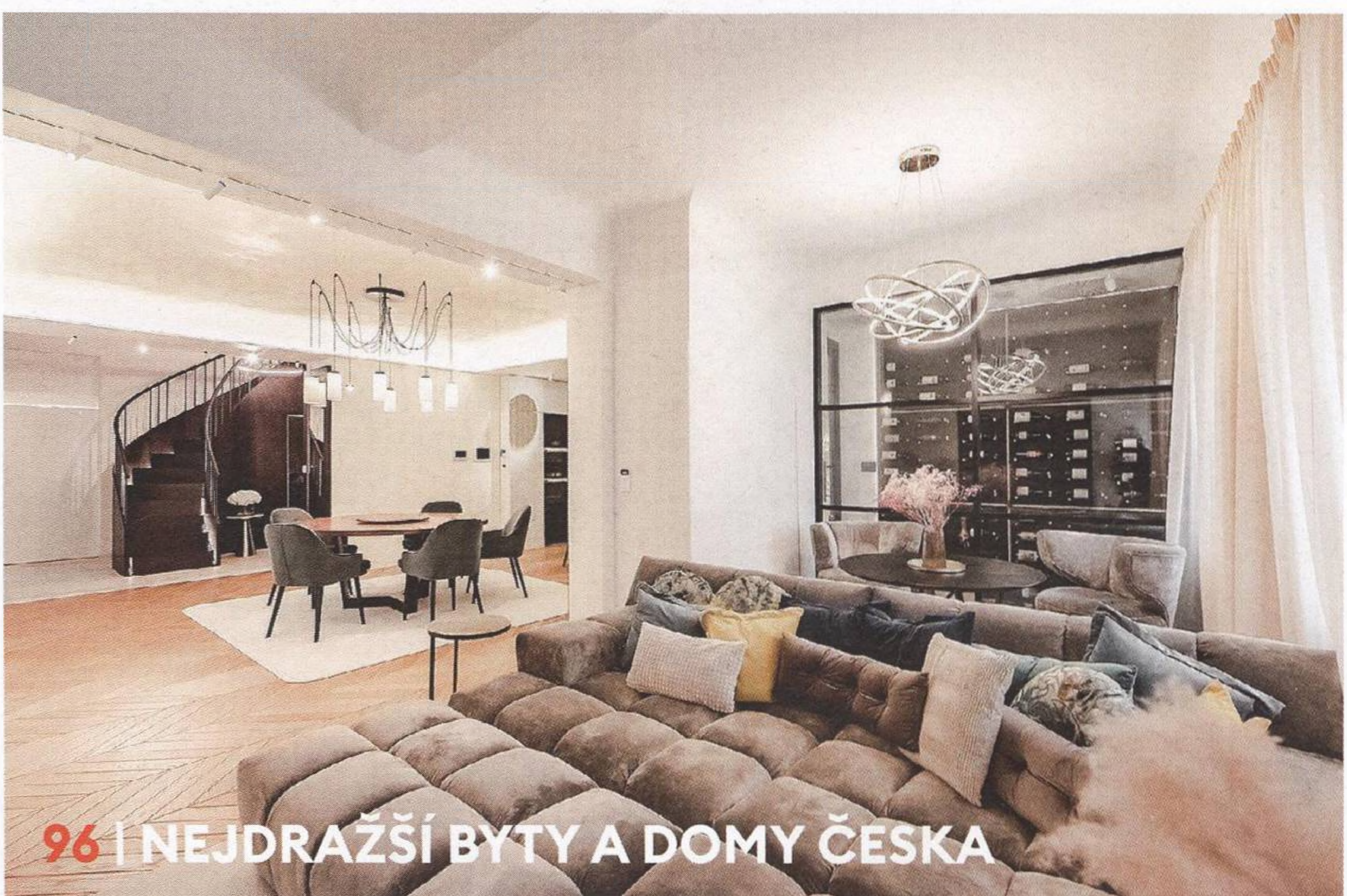
96 | NEJDRAŽŠÍ BYTY A DOMY ČESKA