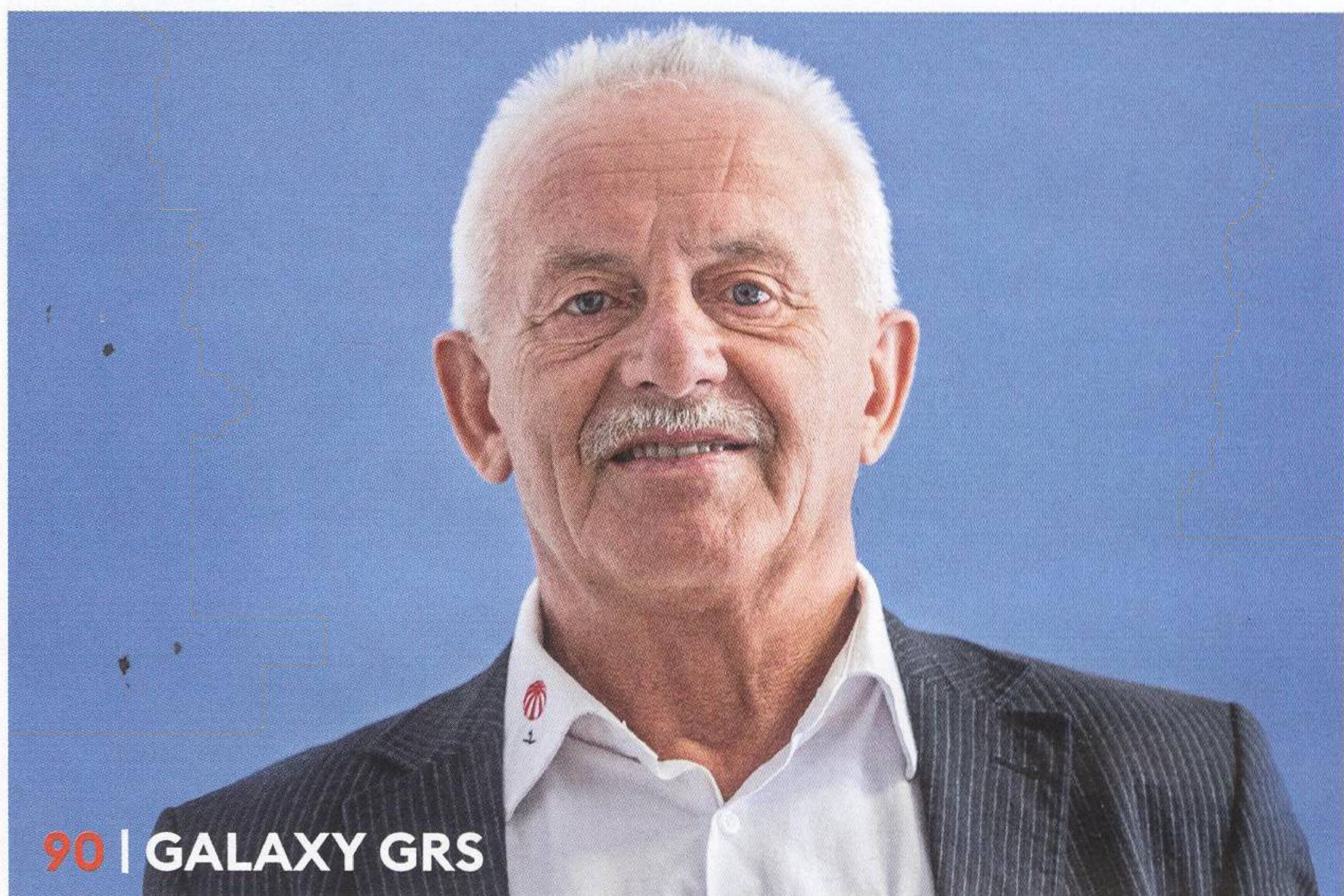
90 | GALAXY GRS