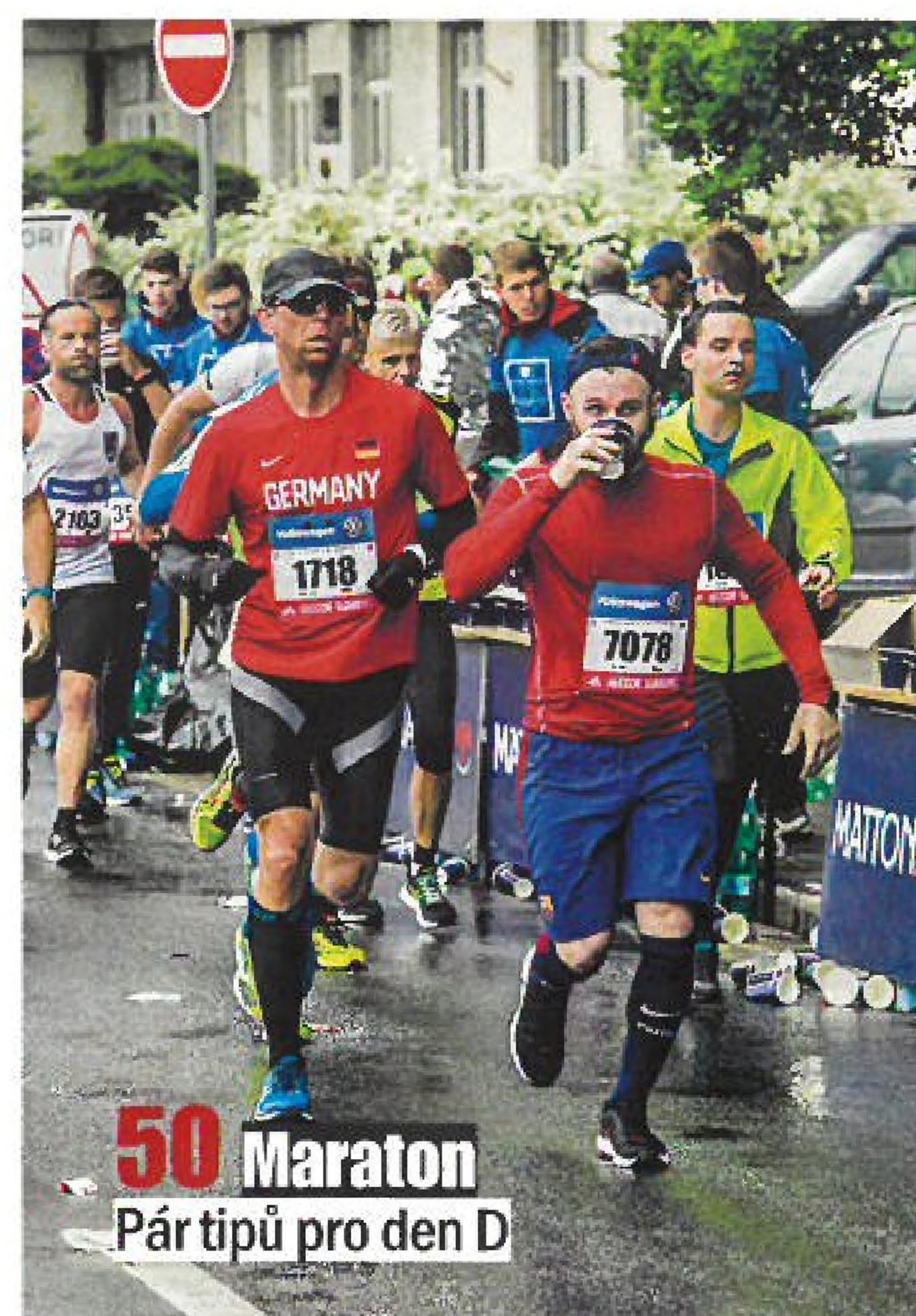
50 Maraton Pár tipů pro den D