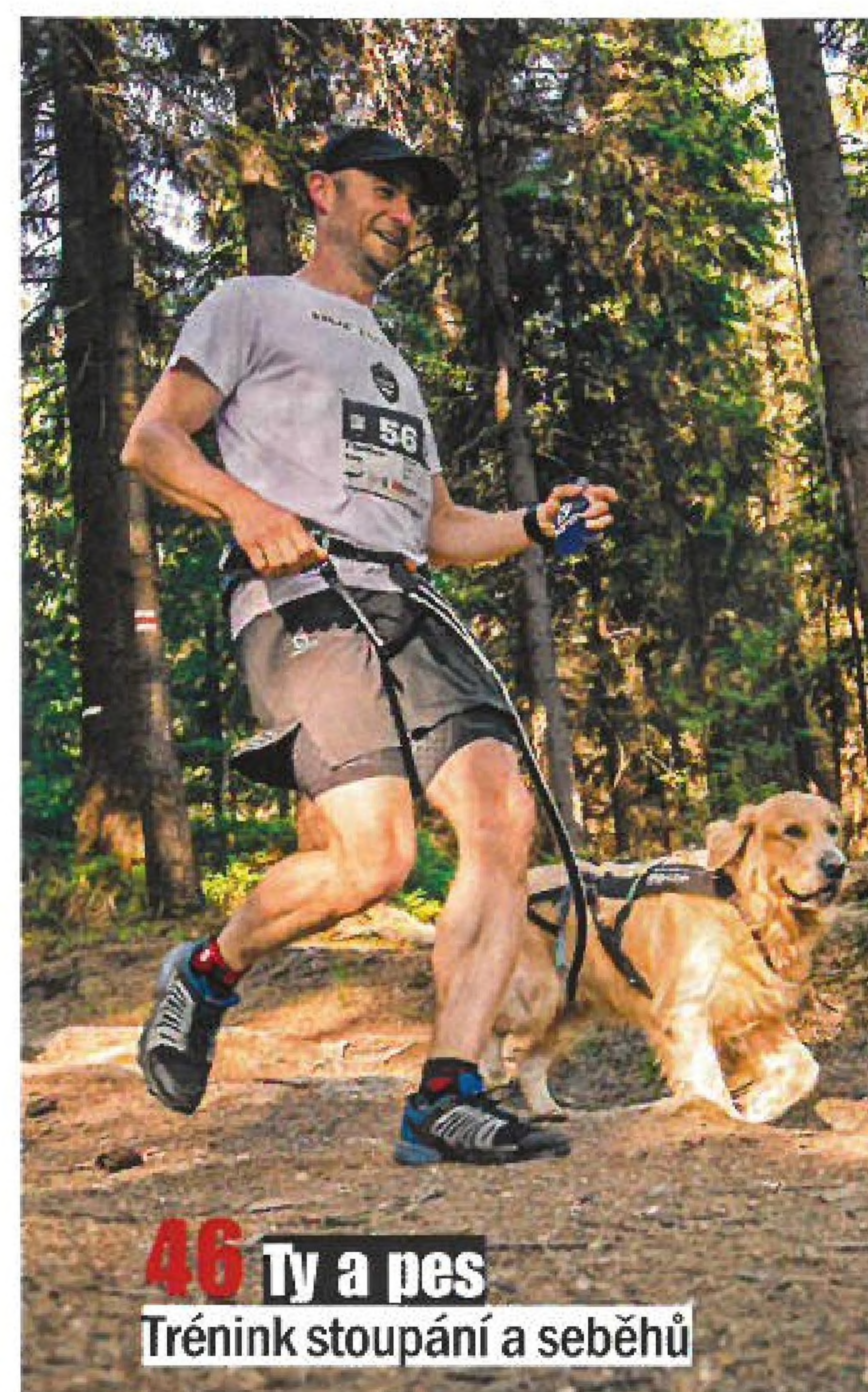
46 Ty a pes Trénink stoupání a seběhu