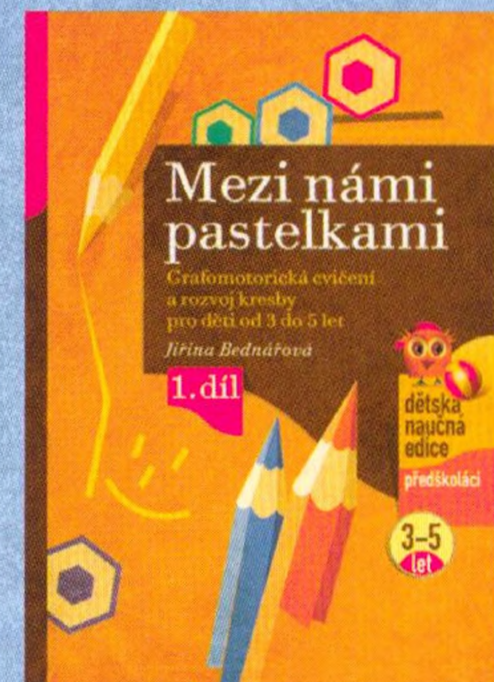
Jiřina Bednářová Mezi námi pastelkami

Další knihy k rozvoji dítěte ve věku od 3 do 5 let: