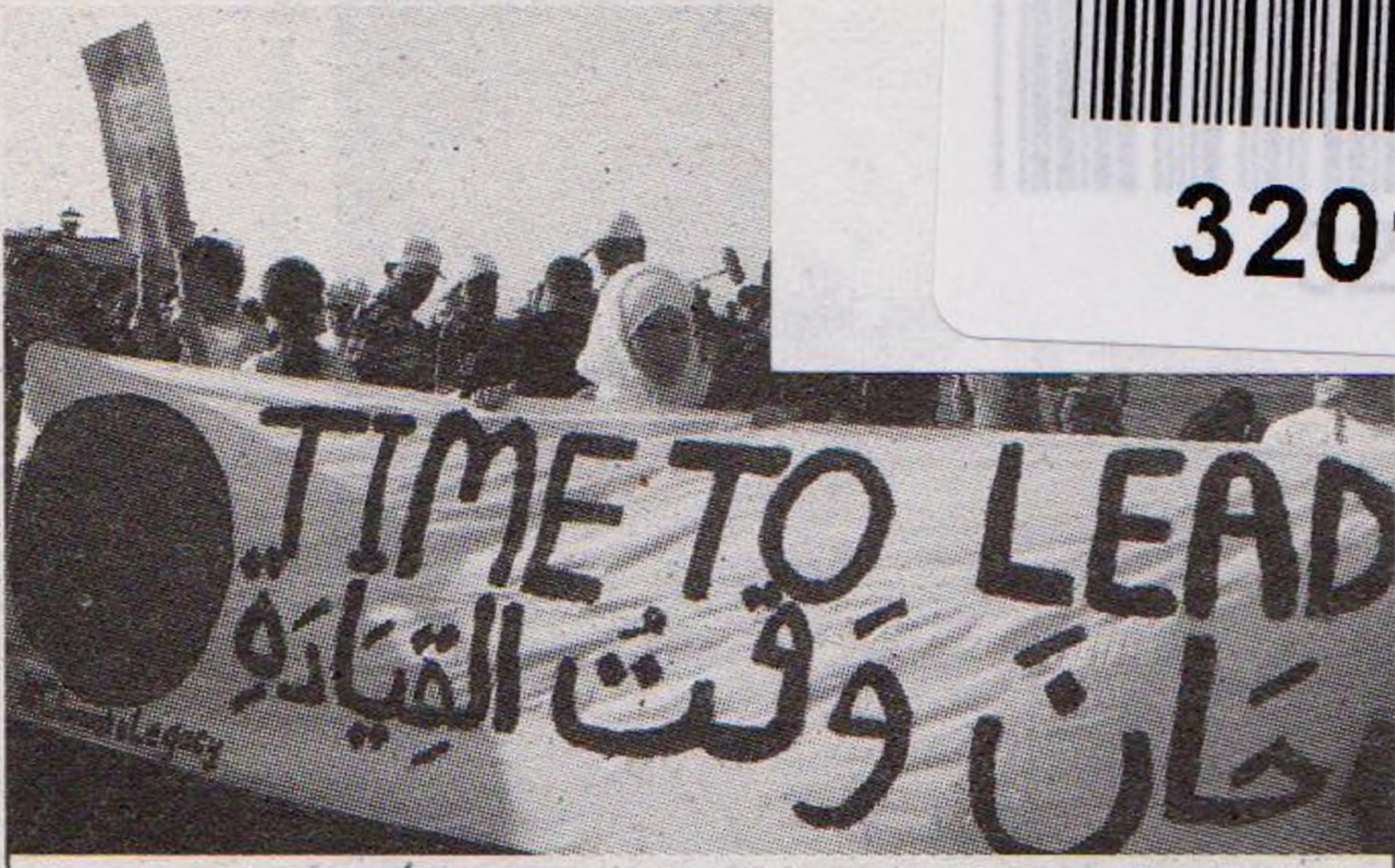
11| Arabské klimatické jaro se nekonalo