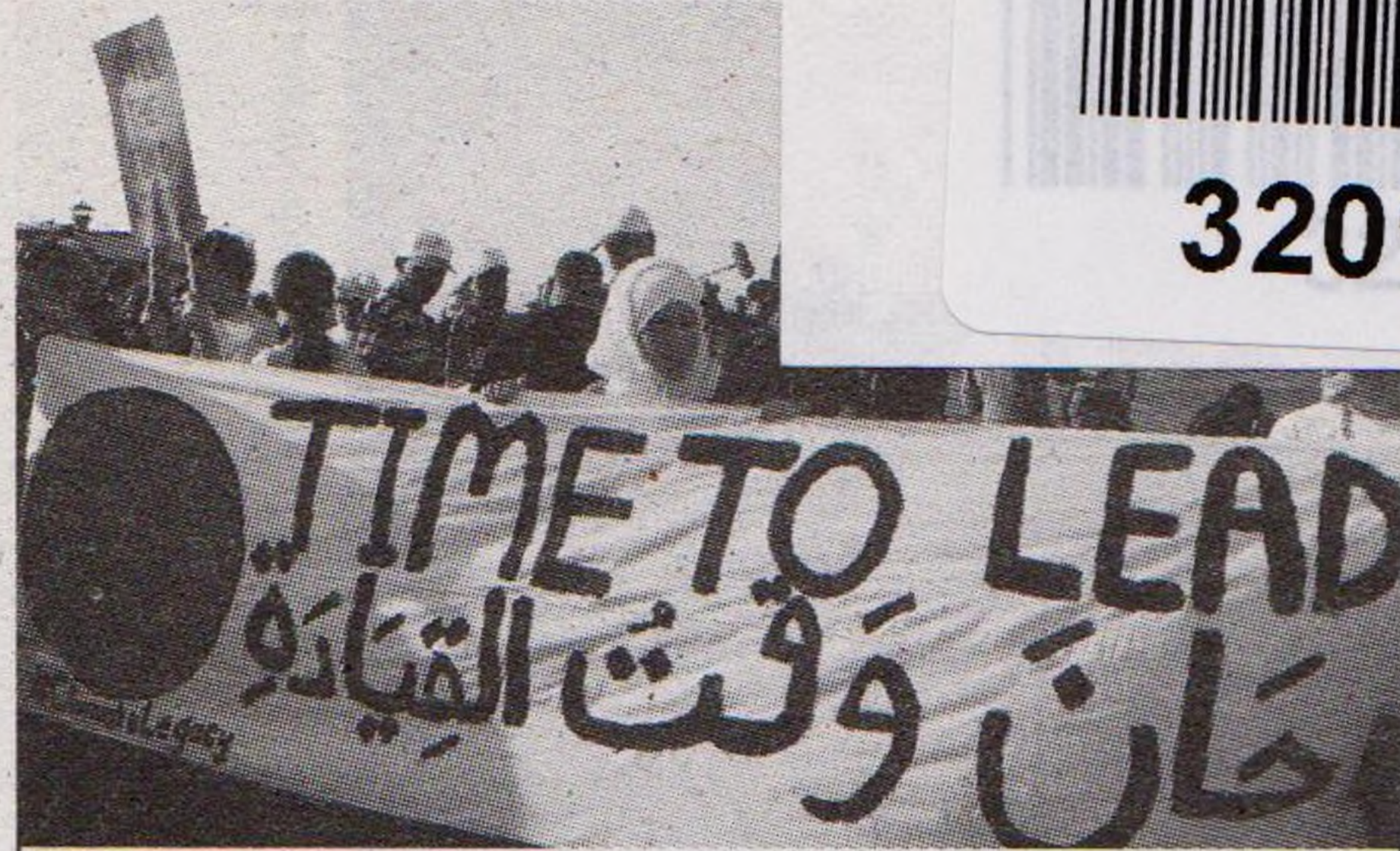
11| Arabské klimatické jaro se nekonalo