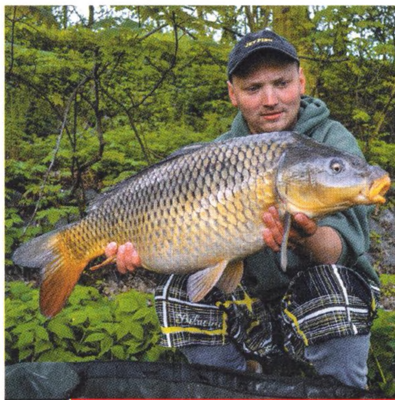
14 Léto na řece