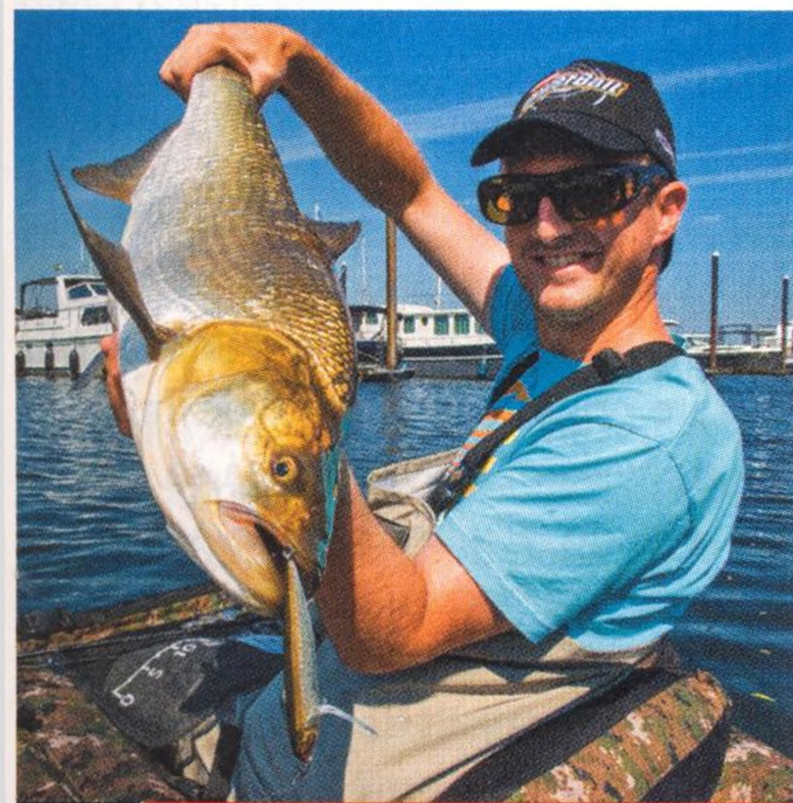
24 Knock-out na hladině