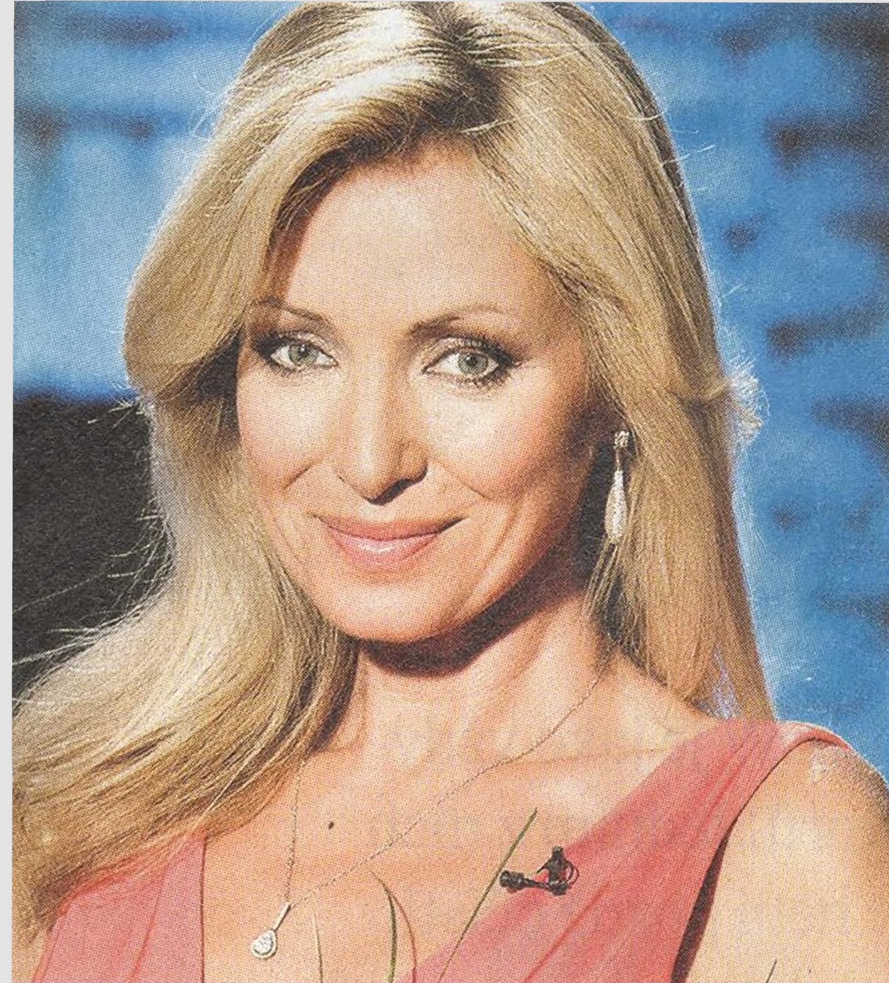
KATEŘINA BROŽOVÁ herečka a zpěvačka