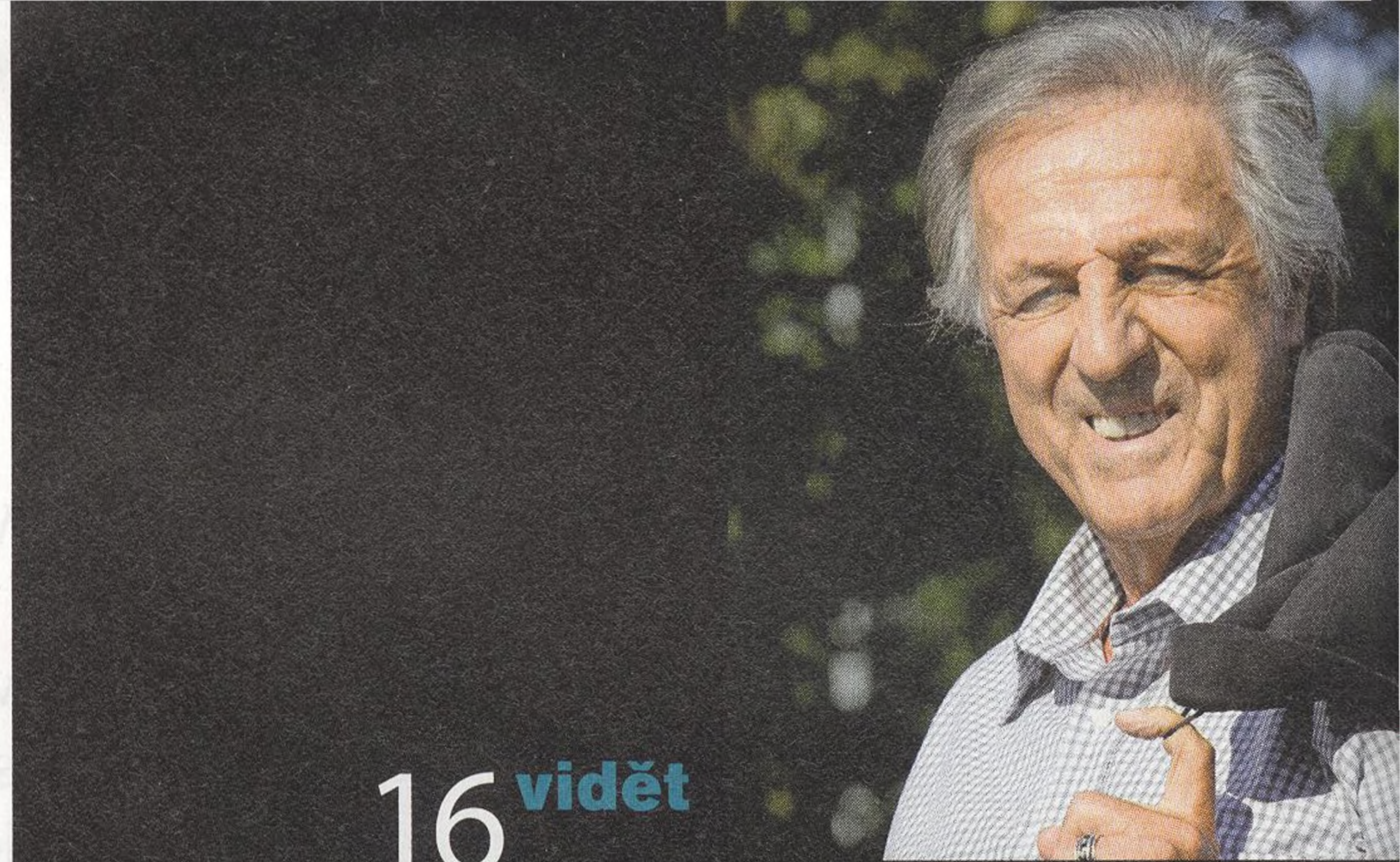
JURAJ VIŠNÝ první československý kulturista

„Růžové brýle jsem sundala před mnoha lety.“