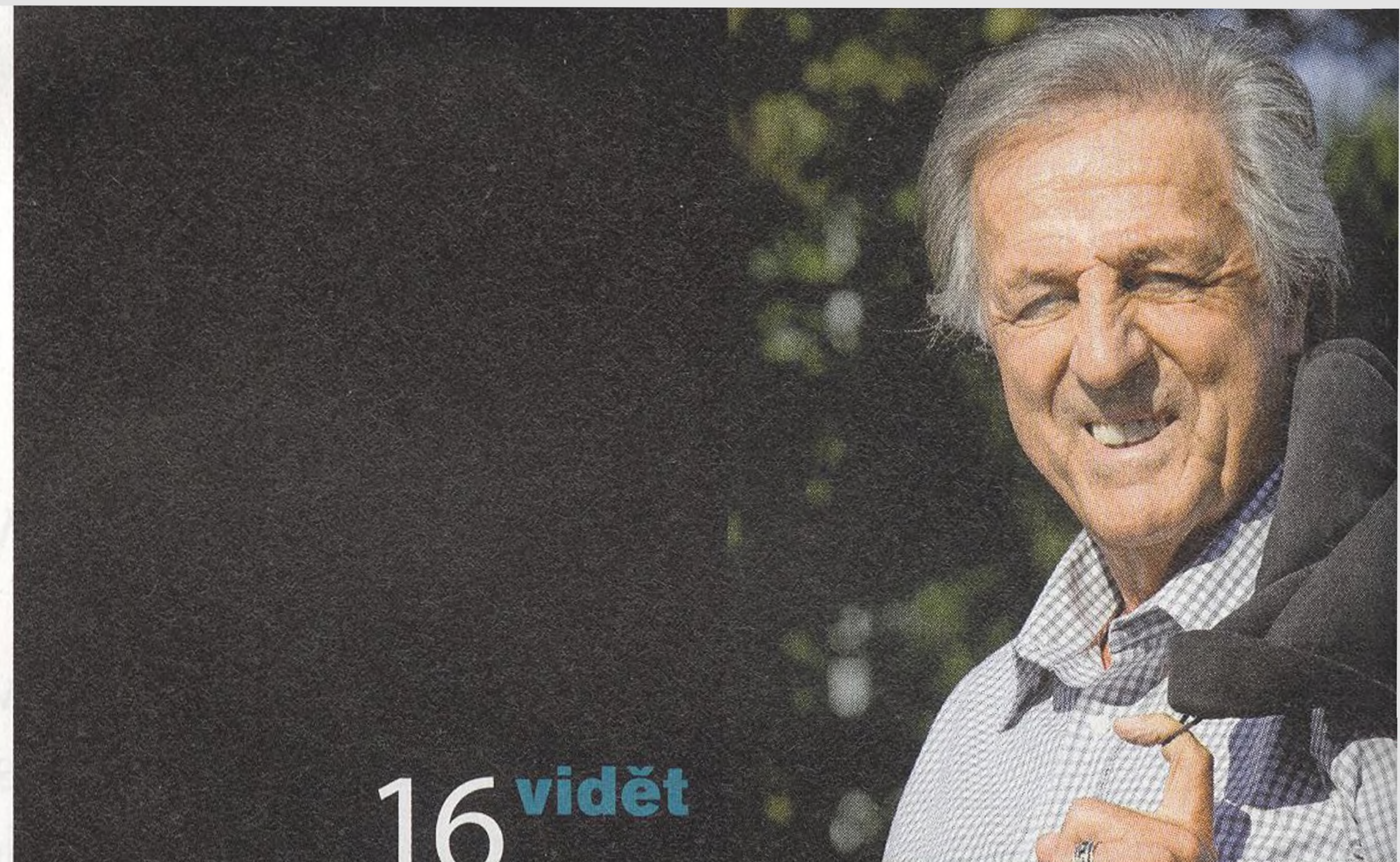
JURAJ VIŠNÝ první československý kulturista

„Růžové brýle jsem sundala před mnoha lety.“