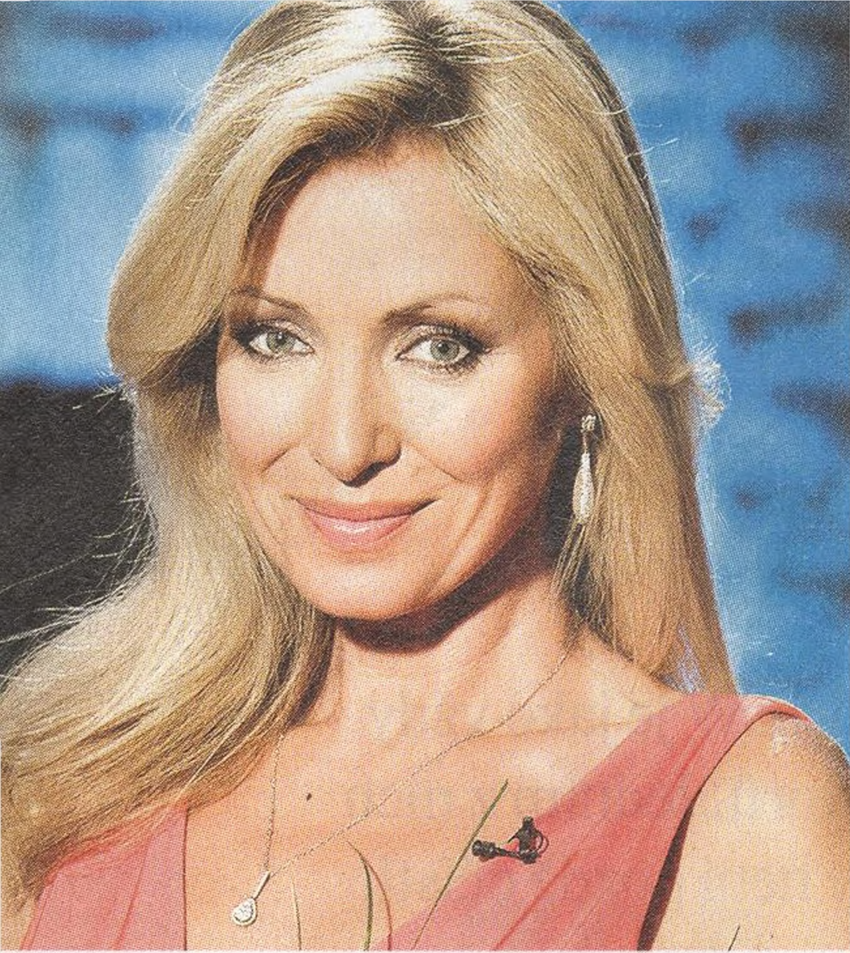
KATEŘINA BROŽOVÁ herečka a zpěvačka