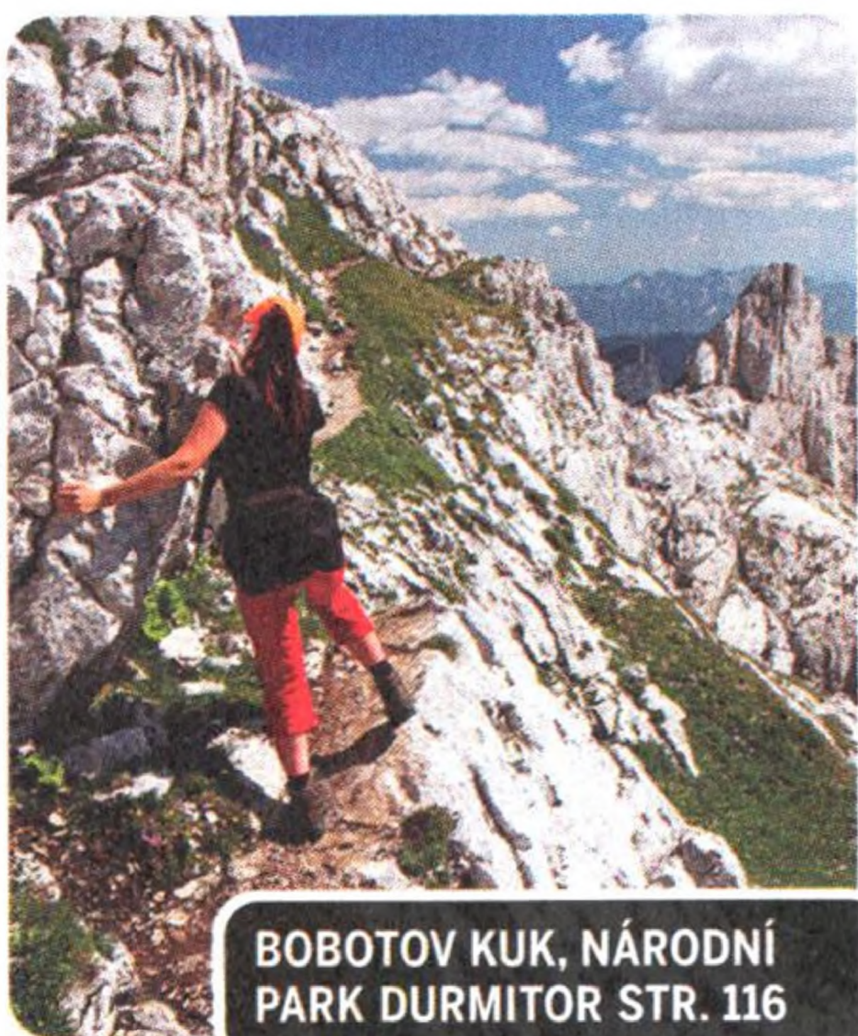
BOBOTOV KUK, NÁRODNÍ PARK DURMITOR STR. 116