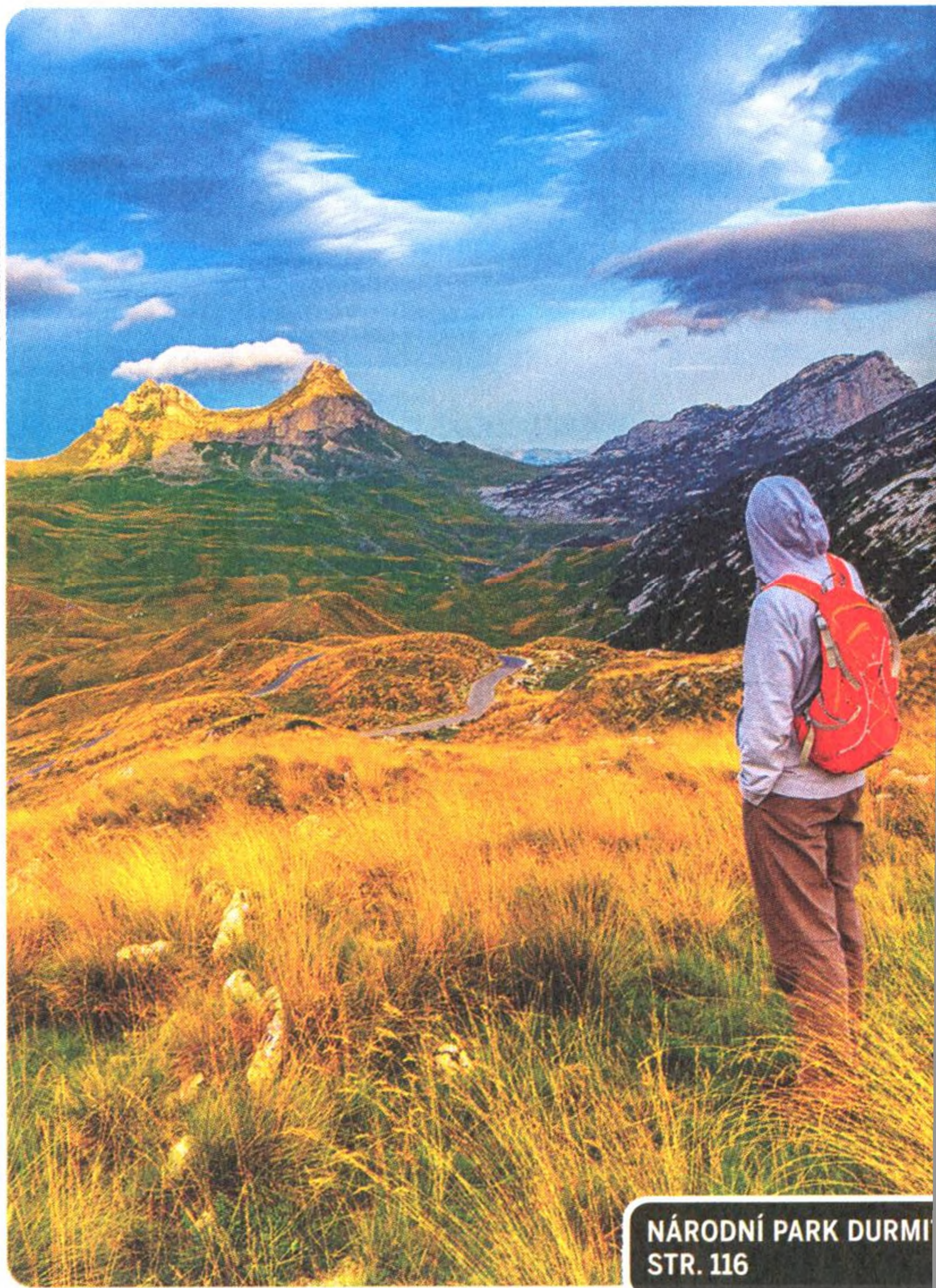
NÁRODNÍ PARK DURMI STR. 116