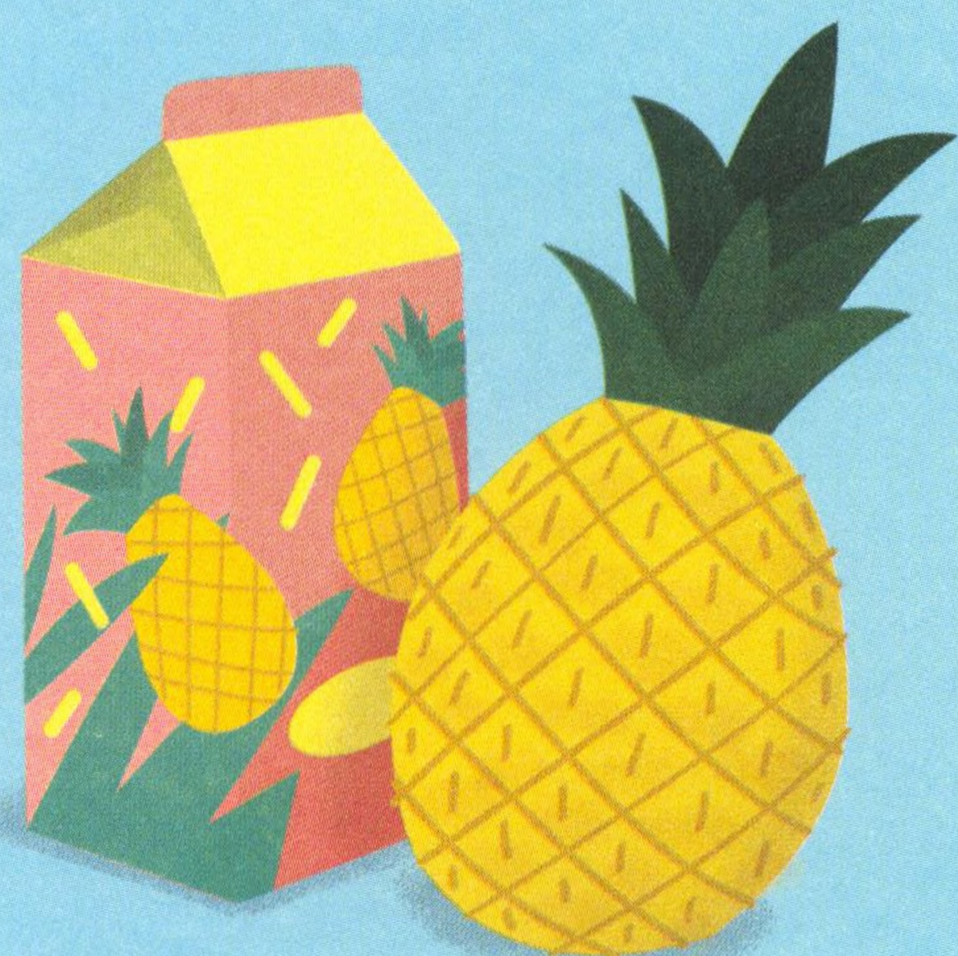
ANANASOVÝ DŽUS, 52