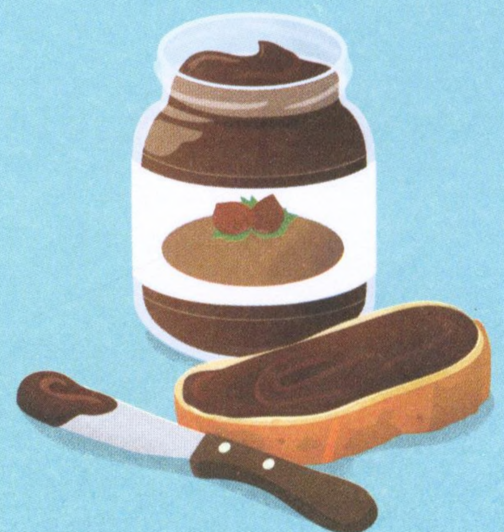
LÍSKOŘÍŠKOVÝ KRÉM, 36