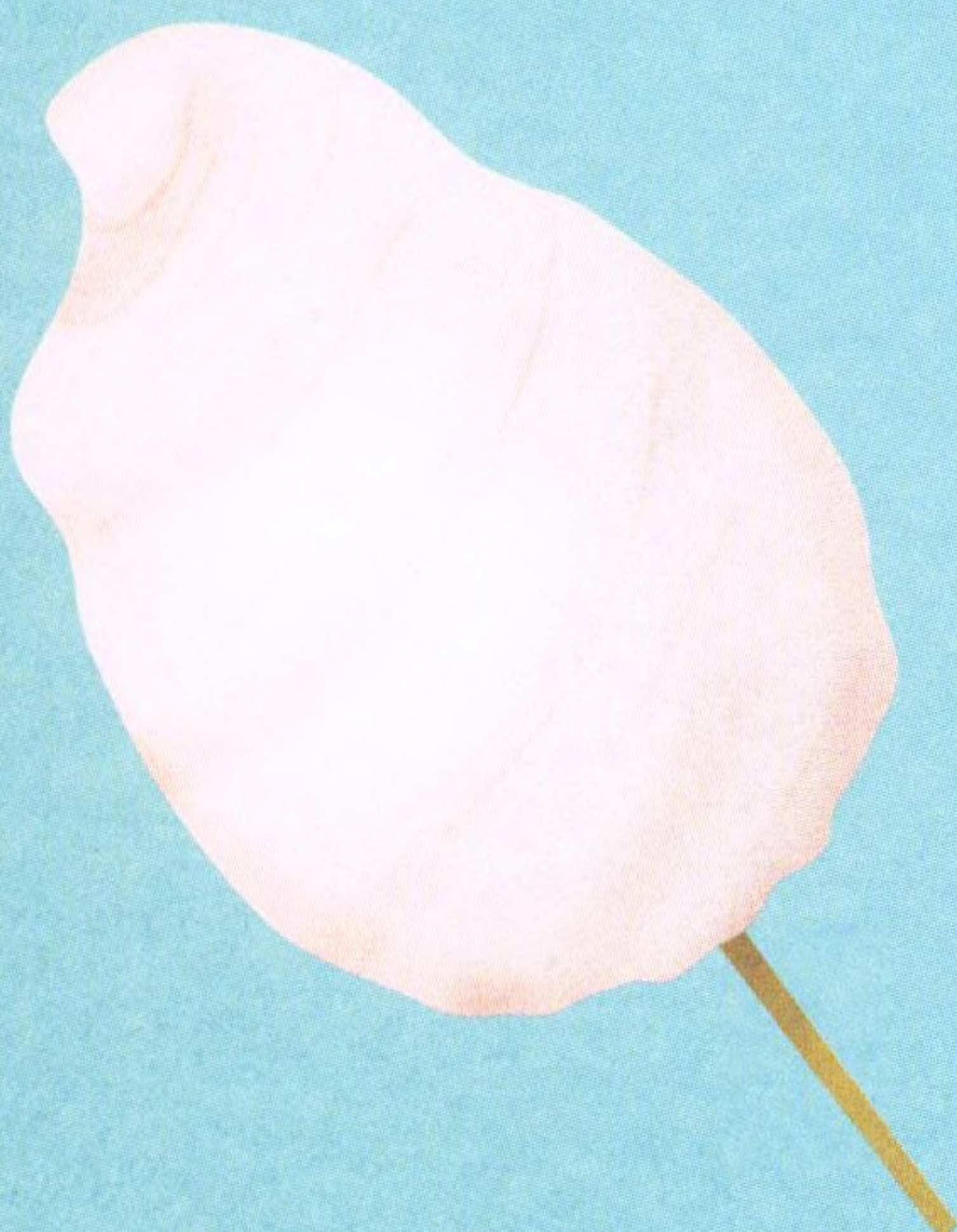
CUKROVÁ VATA, 28