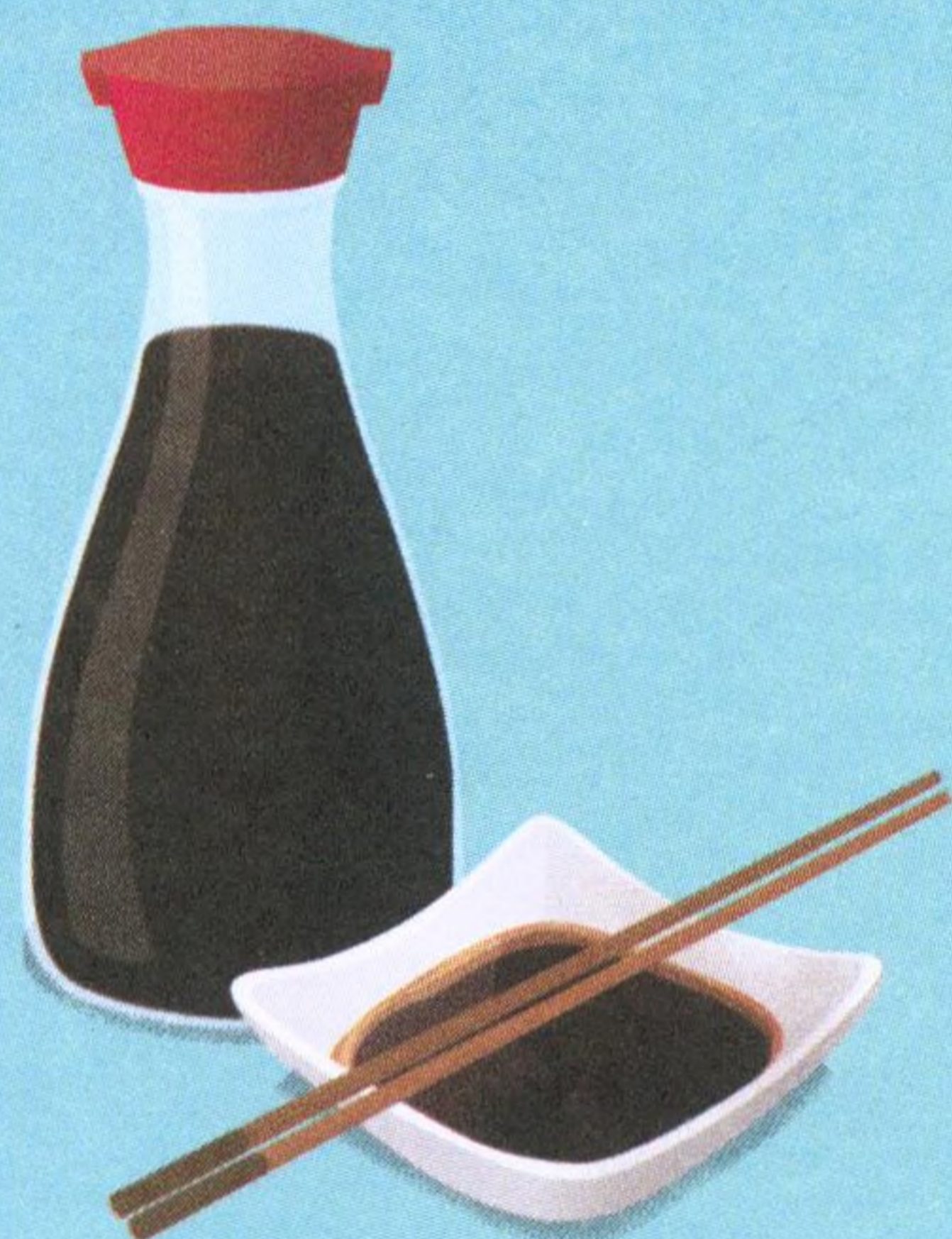
SÓJOVÁ OMÁČKA, 40