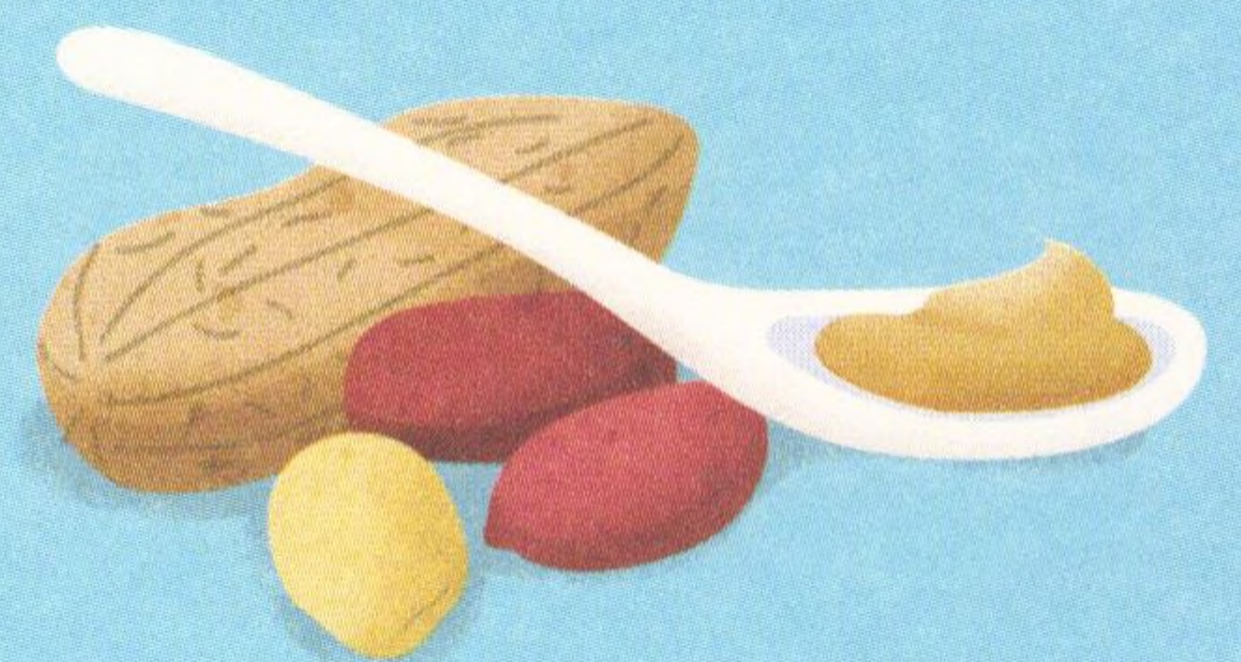
ARAŠÍDOVÉ MÁSLU, 24