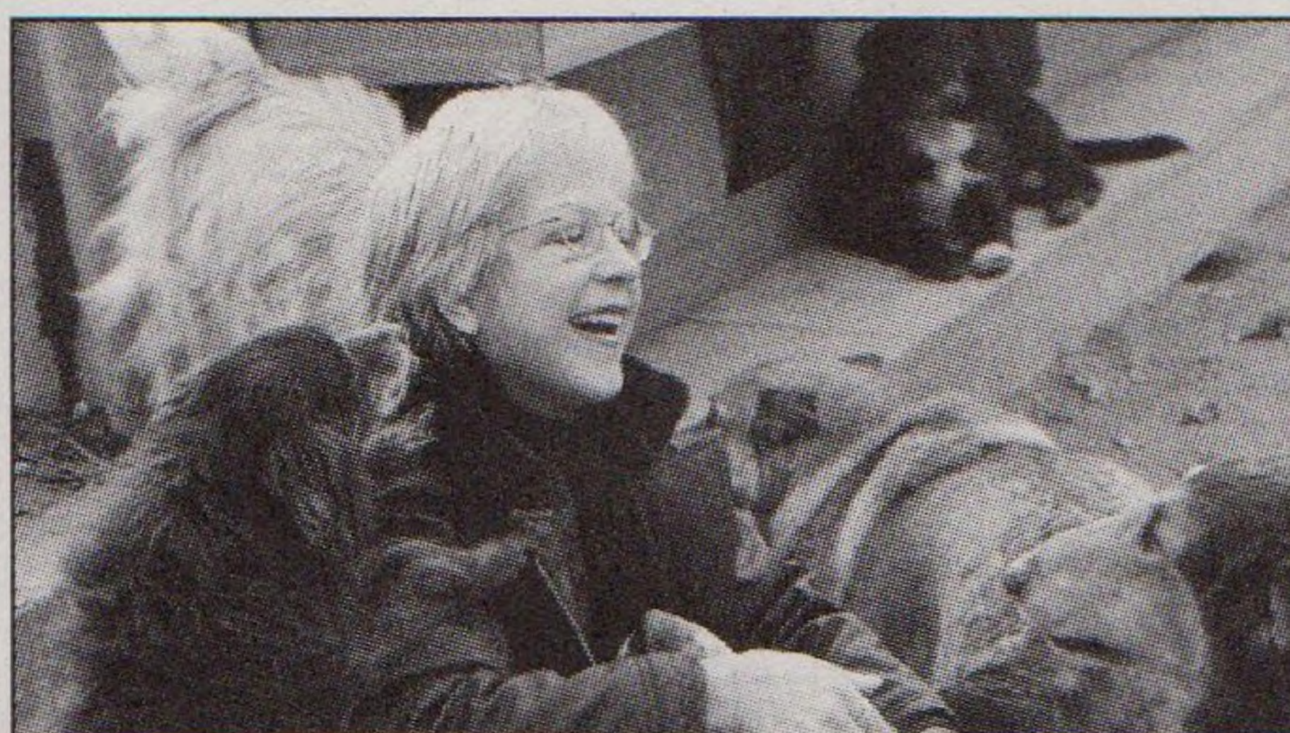
4 | Své psy neopustím!