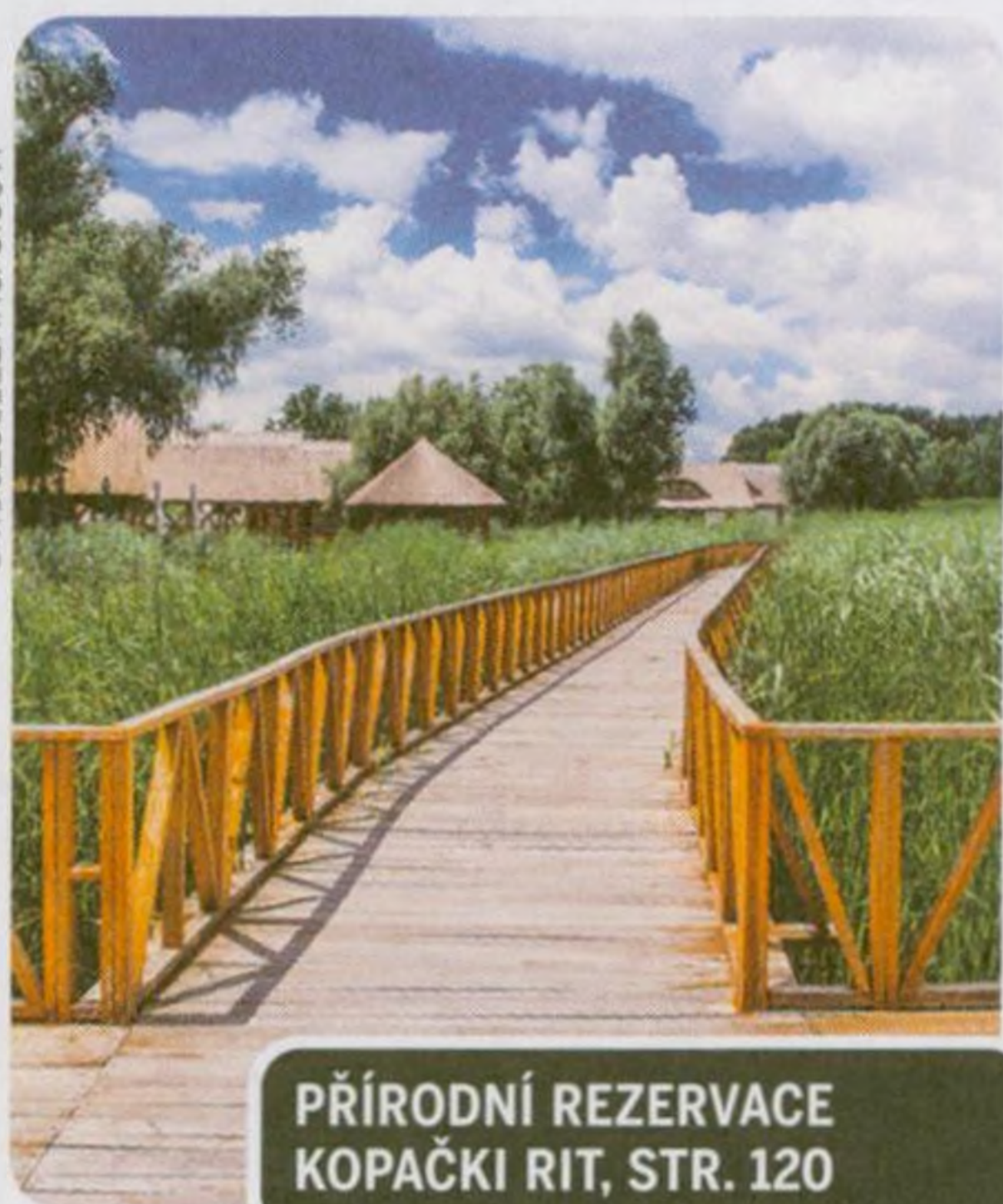
PŘÍRODNÍ REZERVACE KOPAČKI RIT, STR. 120