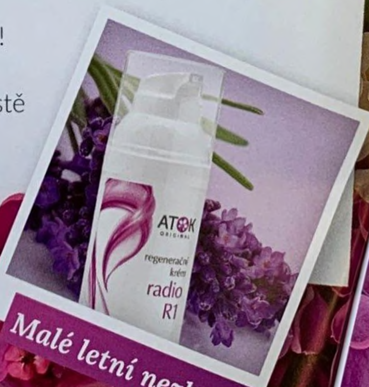
Malé letní nezbytnosti